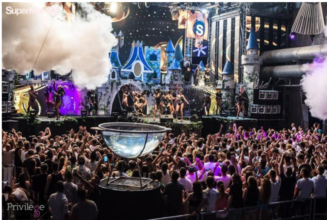
Figura 3: Discoteca Privilege (PRIVILEGE).