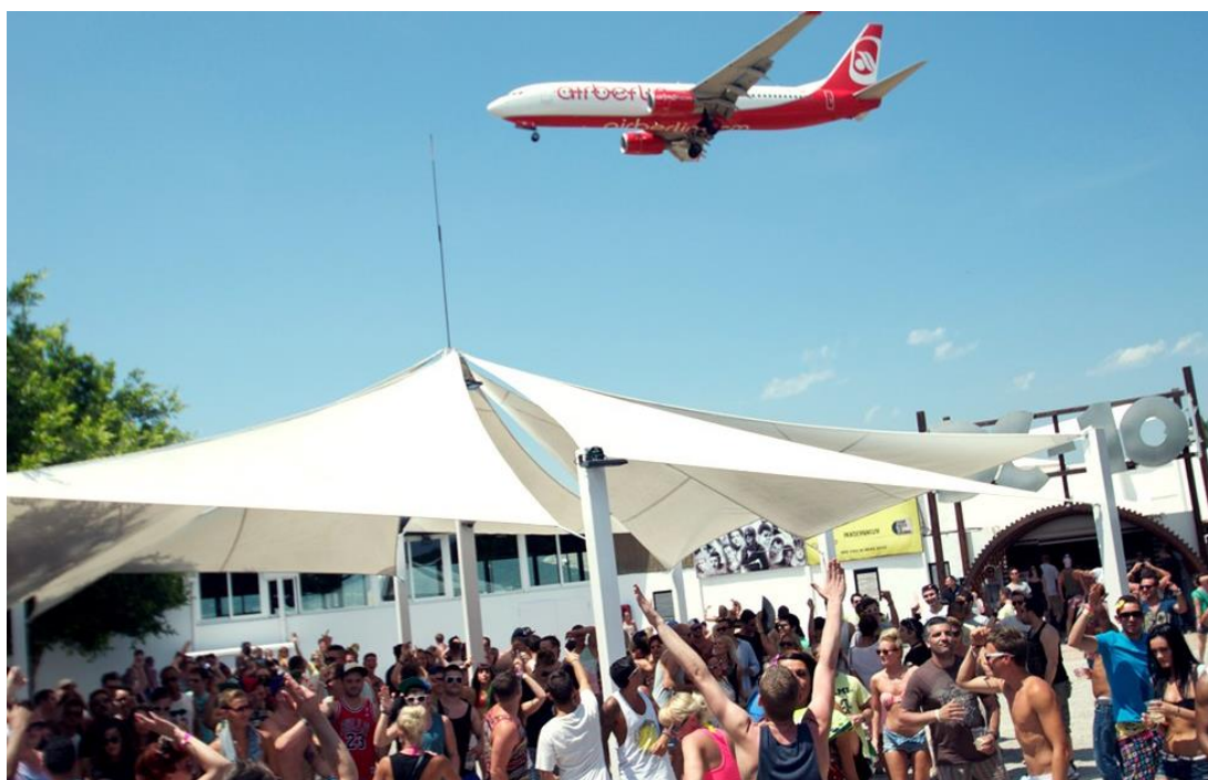
Figura 4: Discoteca DC 10.

2. Establecimientos de ocio nocturno complementarios ( Pre-Party ): Su momento álgido es antes de la media noche y suelen preceder a las fiestas de las discotecas. No están dados de alta como discotecas, sino como bares, restaurantes, cafeterías etc. y se regulan por la normativa del sector de la hostelería y el turismo.