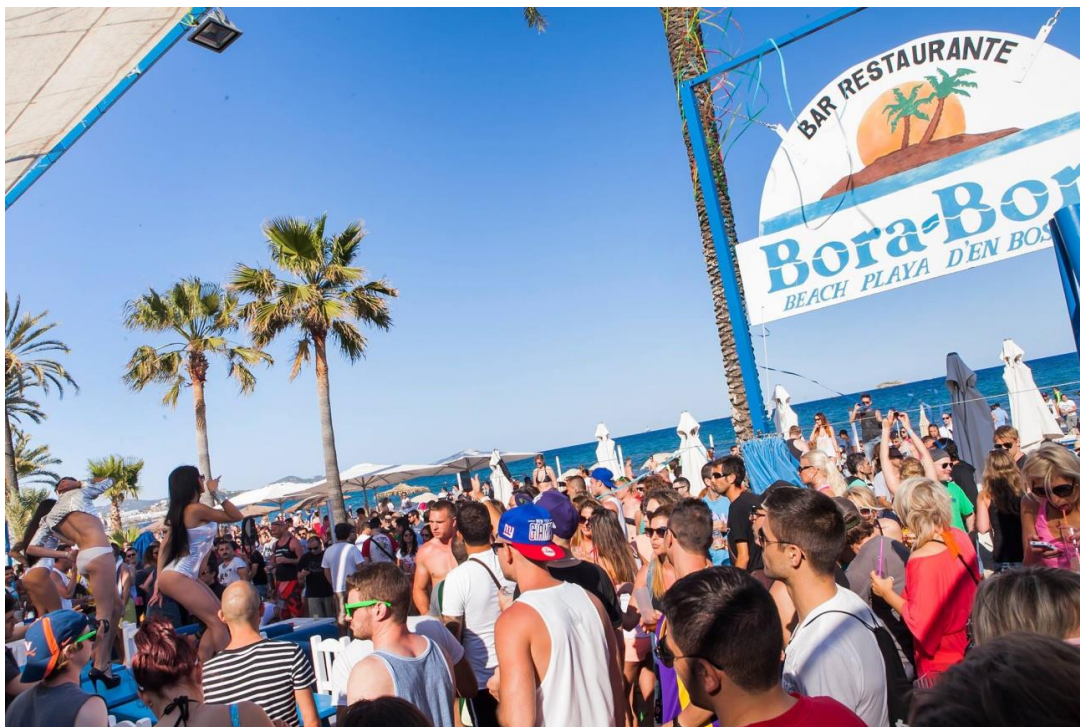
Figura 5: Beach Club Bora Bora, Playa d'en Bossa (BORA BORA).