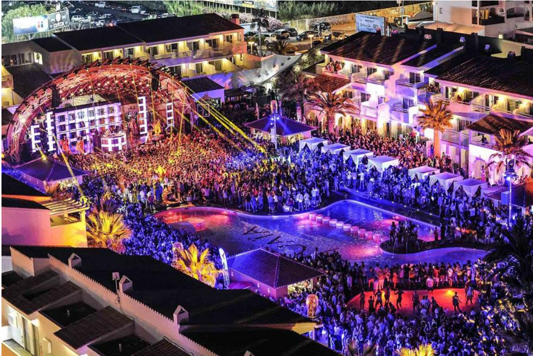
Figura 7: Ushuaia Ibiza Beach Hotel, Playa d'en Bossa (PALLADIUM HOTEL GROUP).

2.2.4. Restaurant & Cabaret : recientemente están abriendo restaurantes con espectáculo como es el caso de Lío, con un espectáculo inspirado en el cabaret, SubliMotion, que busca convertir las cenas en un espectáculo para la percepción y la emoción, o Heart, creado entre los hermanos Adrià y el Circo del Sol. El Restaurante Cabaret Lío (Figura 8) pertenece al grupo Pachá y es el resultado de la reconversión de la antigua discoteca El Divino.