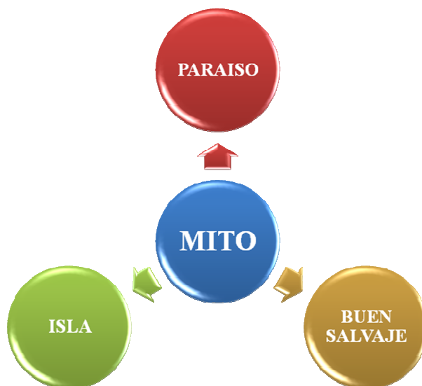
Figura 1: Elementos del Mito

La narración mítica no es una estructura estable sino que toma diferentes formas dependiendo de la época (Korstanje, 2011b) y la sociedad en que es interpretada y narrada. No es posible determinar si las similitudes entre mitos se deben a que evolucionaron de una versión primigenia universal o que en situaciones parecidas se crearían mitos parecidos. Para decantarse por una de las dos opciones de su origen sería necesario su análisis en épocas en las que aún no existía la escritura.