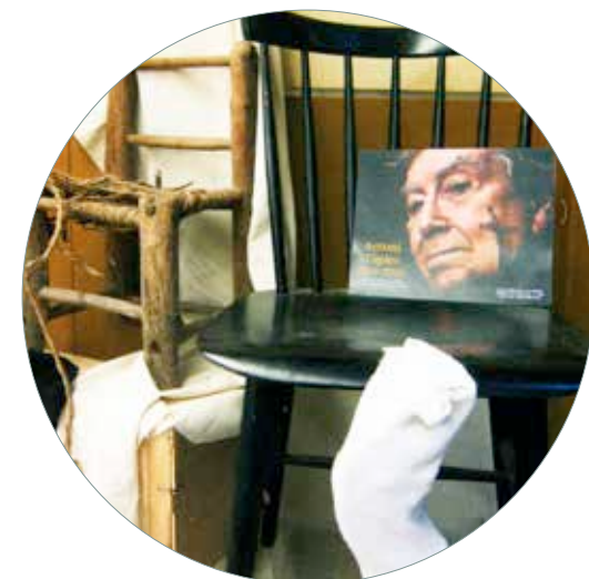
Treballs dels alumnes del Taller Antoni Tàpies de Carrau Blau.

De fet, la col·lecció Fragments és ja una obra imprescindible en els llistats bibliogràfics de les assignatures d'educació artística de les diferents facultats d'educació, per tal com cada exemplar inclou un apartat de "referents per a la didàctica", adreçat als mestres i als estudiants d'educació.