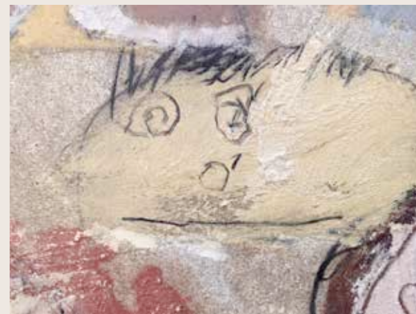
Fragment d'un retrat fet per un nen petit a La paret dels infants. Carrau Blau

Sabíeu fer aquests magnífics retrats abans de fer-los?