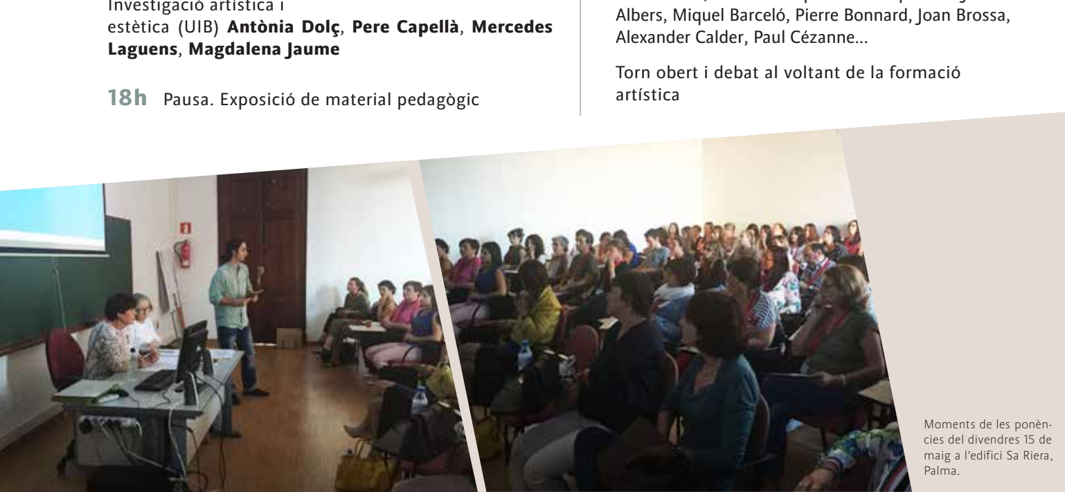
Moments de les ponències del divendres 15 de maig a l'edifici Sa Riera, Palma.

14h Distribució dels certificats d'assistència