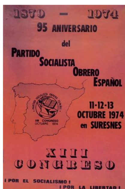
Ilustración 7 Cartel del Congreso de Suresnes de 1974.

En Suresnes destacaron de forma importante “ El Grupo de Sevilla ” con Felipe González a la cabeza. Inicialmente, los dirigentes del PSOE en el exilio negaron la presencia de los jóvenes valores del partido y tras unas discusiones, así como poner algunas cosas en común pudieron participar. Así, Felipe González fue elegido Secretario