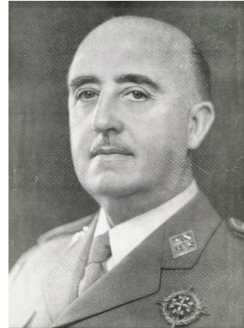
Ilustración 1 Francisco Franco Bahamonde (1892-1975)

El final del franquismo podemos incidir que se va produciendo a medida que Franco comienza a tener graves problemas de salud y que poco a poco irán mermando la salud de un Régimen que había comenzado con una Guerra Civil y con una gran cantidad de represaliados que van desde depuraciones, penas de cárcel, condenas a muerte y, sobre todo, el exilio.