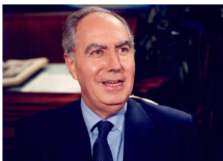
Ilustración 12 Félix Pons.

Por último, en 2019, sigue siendo afiliado al PSIB-PSOE y es una voz escuchada por los militantes de todas las edades.