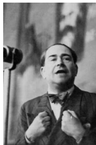
Ilustración 6 Rodolfo Llopis.

El PSOE que nos encontramos en Suresnes era un partido que mantenía una estructura latente en el exilio y que encabezaba Rodolfo Llopis como Secretario General, sin embargo, en el interior de España se habían producido algunos movimientos por parte de algunos militantes desde la clandestinidad. Por ejemplo, en el XXIV Congreso celebrado en Toulouse en 1970 es donde se comenzó a palpar la división del partido en dos sectores: Se salvo la coexistencia entre unos viejos dirigentes del exilio alejados de realidad cotidiana y que pasaban parte de su tiempo discutiendo, proponiendo y conspirando alrededor en charlas de café. Mientras que unos jóvenes militantes desde la clandestinidad mantenían una lucha diaria en los centros de trabajo, estudios y las diferentes asociaciones vecinales. Estos fueron los principales motivos que provocaron la escisión del partido entre “ renovadores ” e “ históricos ” que provocaron la necesidad de sustituir a los dirigentes socialistas exiliados que capitaneaba Rodolfo Llopis desde 1944.