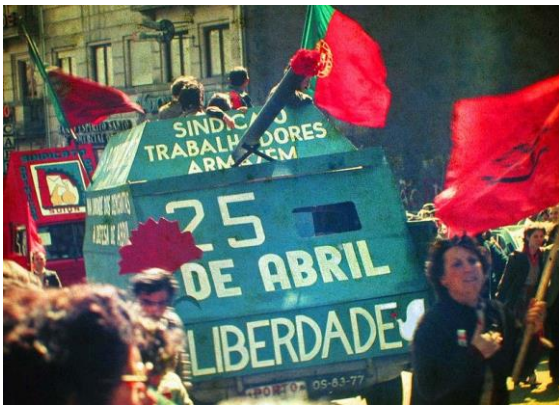
Ilustración 2 La Revolución de los Claveles.

El 12 de febrero de 1974. Arias Navarro comparece en la Cortes para anunciar las siguientes reformas: Una ley para regular las constitución de asociaciones políticas respetuosas con el Régimen; un cambio en la ley de régimen local, para que los cargos