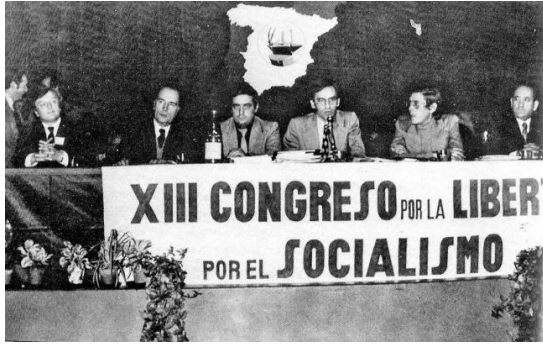
Ilustración 8 Celebración del Congreso de Suresnes con presencia de Mitterrand.

General del PSOE y se convertía en la cabeza visible del Socialismo en España. En este “ Grupo del interior ” González contaba con el apoyo no sólo de Alfonso Guerra y los compañeros de Sevilla, sino que también, contó con los delegados de las otras federaciones del interior que le dieron su apoyo fueron los vascos con Enrique Mujica,