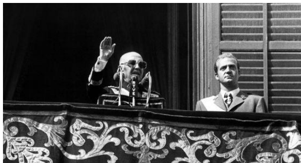
Ilustración 3 Manifestación del 1 octubre de 1975. Franco junto al Príncipe Juan Carlos.

nuevo gobierno con afines al Movimiento, entre los nombramientos figuraba un joven falangista llamado Adolfo Suarez.