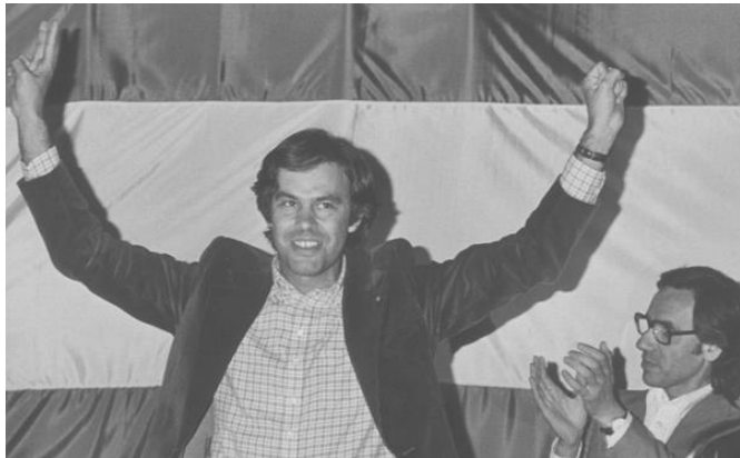
Ilustración 9 Felipe González elegido Secretario General del PSOE en Suresnes.

Por último, la consecuencia más importante del XXVI Congreso del PSOE fue la irrupción del partido y, sobre todo, la puesta en escena de Felipe González, quien se convertiría desde este momento en el gran líder del socialismo en España. Además, el PSOE buscaba una forma de alejarse de los postulados del Partido Comunista para ir cogiéndole terreno de cara a los posibles envites electorales.