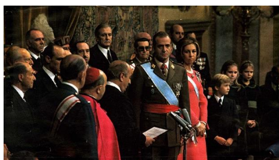
Ilustración 4 Proclamación de Juan Carlos I.

El primer paso, fue posible una vez que Adolfo Suarez fue nombrado Presidente del Gobierno en julio de 1976 cuando Arias Navarro presenta su dimisión. La transición estuvo liderada por tres personas de distintos niveles y con diferentes funciones, tuvieron un papel decisivo en el diseño de la transición: El Rey Juan Carlos como Jefe de Estado, Torcuato Fernández Miranda, como