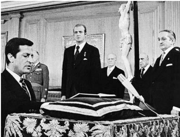
Ilustración 5 Los artífices de la Transición: Juan Carlos I, Torcuato Fernández Miranda y Adolfo Suarez.

Juan Carlos I fue el motor del cambio, quien dio el impulso primero a la Democracia en los primeros seis meses de reinado, con un Arias Navarro muy dubitativo y que no estaba por la labor de llevar una reforma política. La capacidad regia le venía dada por