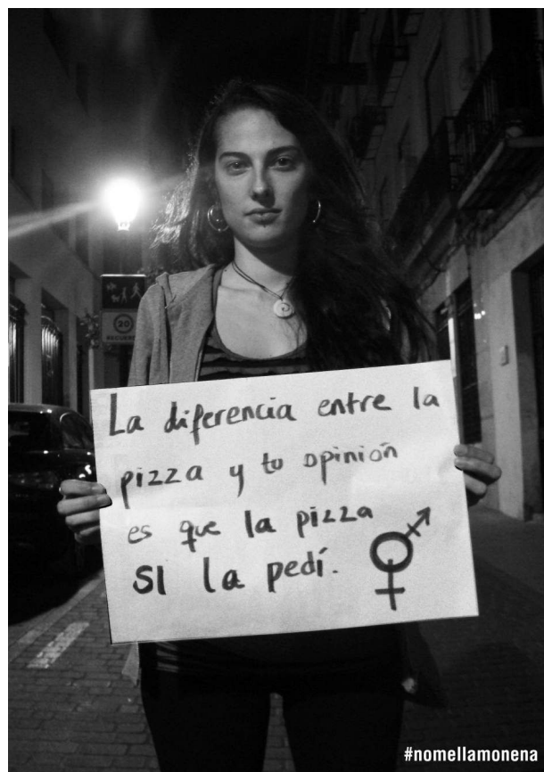
Figura 1. Fotografía de la campaña #nomellamonena . (Fuente: No Me Llamo Nena, s.f).

grupos feministas, apoyándola en su labor, pero también ha provocado respuestas de boicot por parte de grupos machistas, a partir de contra-campañas y de comentarios en los espacios por los que se difundió la campaña (Berenguer, Vayá y Bouchara, 2016). Una contra-campaña destacada fue la creación del blog #nomellamonene , el cual utilizó las fotografías originales pero cambiando los mensajes por otros, como por ejemplo, “no me juzgues por mi aspecto, barro y friego perfecto” o “cuando cojo la escoba me siento toda una señora” (Berenguer, Vayá y Bouchara, 2016, p. 150). A continuación, se presentan algunas de las fotografías de la campaña #nomellamonena :