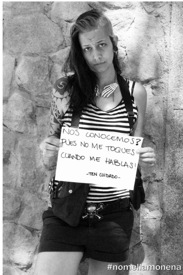
Figura 2. Fotografía de la campaña #nomellamonena.