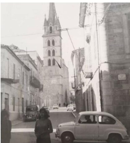
Fig. 23: Carrer concepció.