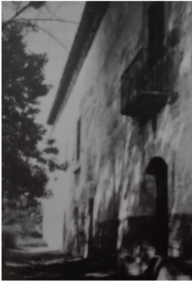
Fig. 28, fig. 29, fig. 30, fig. 31 i fig. 32.: Can Gelabert. Imatges extretes de Pascual, Aina i Llabrés, Jaume (1991). Can Gelabert de la Portella (Binissalem) . Binissalem. Ajuntament de Binissalem., p. 20, 34, 35.