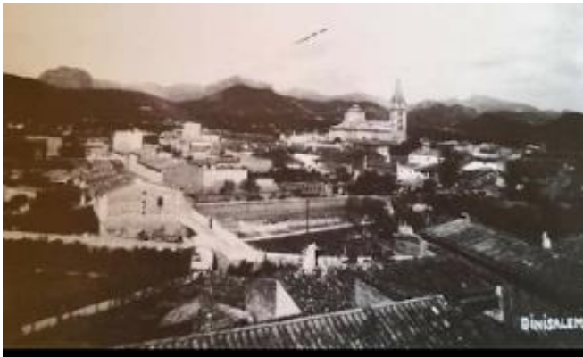
Fig. 10.: Binissalem. Col·lecció Pere Mascaró. Extreta de Salom Pons, Jeroni (1995). Binissalem: imatges d'ahir . Palma. Miquel Font, p: 37.