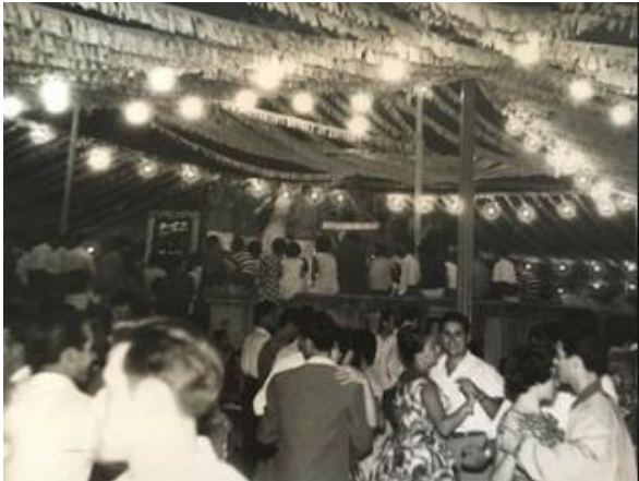
Fig. 27.: Berbena de Sant Jaume anys 60.