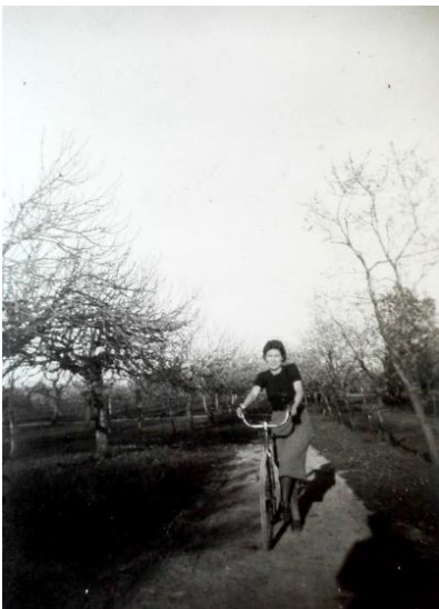
Fig. 36.: Al·lota amb bicicleta. Any 1939.