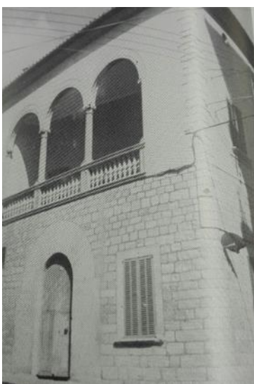
Fig. 14: Rectoria.