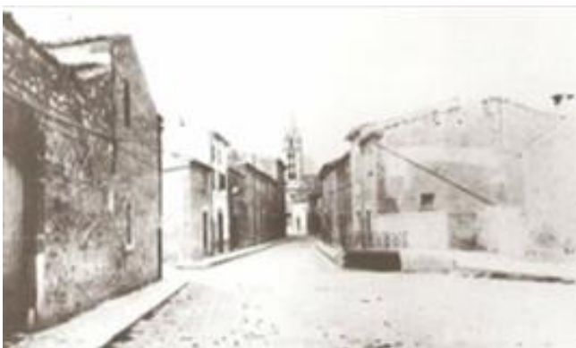
Fig.8.: Es Pontarró.