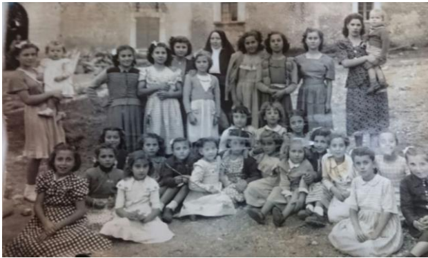
Fig. 44.: Excursió de l'escola de les monges de la Caritat. Any 1954.