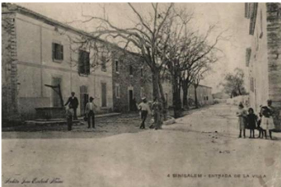
Fig. 13: Carrer Creu.