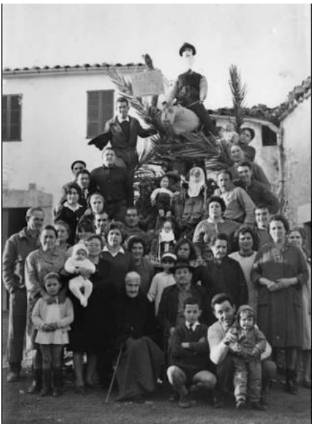
cedida per Salvador Cànoves.