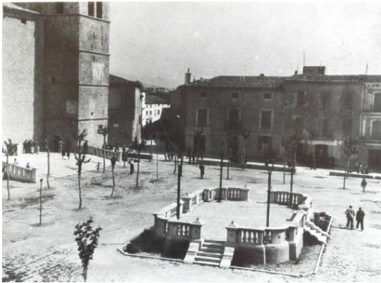
Fig. 2 : Plaça de Binissalem.