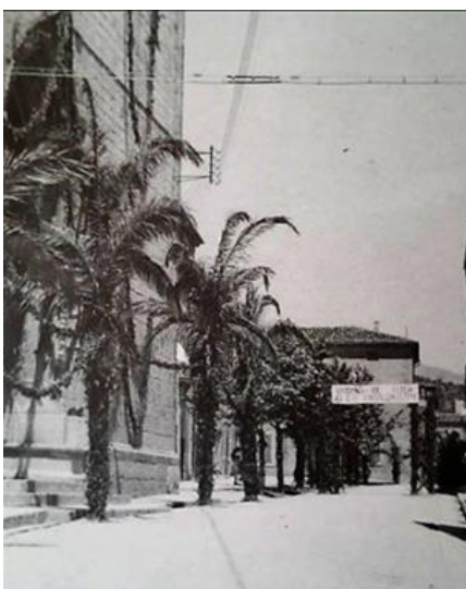
Fig. 11.: Es Born adornat en honor a la Verge de Lluc.