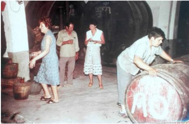
Fig. 43.: Bodegues Oliver. Any 1970.