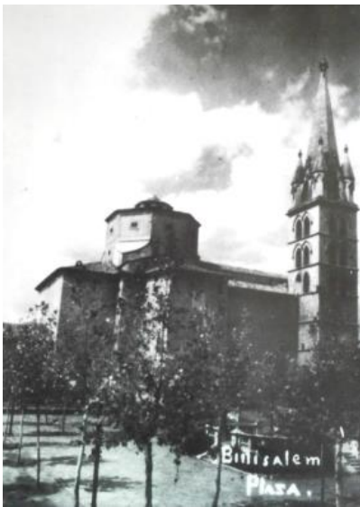
Fig 3.: Plaça de Binissalem. Col·lecció Pere Mascaró. Extreta de Salom Pons, Jeroni (1995). Binissalem: imatges d'ahir . Palma. Miquel Font, p:25.