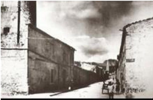
Fig. 7.: Carrer Bon Aire. Col·lecció Pere Mascaró. Extreta de Salom Pons, Jeroni (1995). Binissalem: imatges d'ahir . Palma. Miquel Font, p: 31.