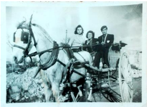
Fig. 35. Amics amb carro. Any 1939.