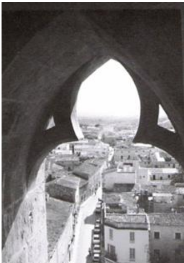
Fig. 16: Carrer Concepció vist des del Campanar de l'Església.