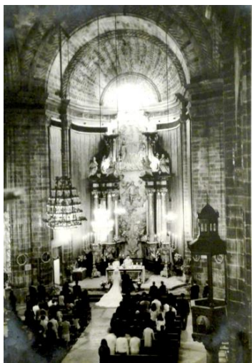
Fig. 42.: Església de Binissalem. Any 1967.