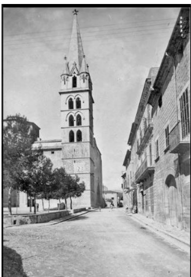
Fig. 17: Campanar de l'església de Binissalem i Born al fons.