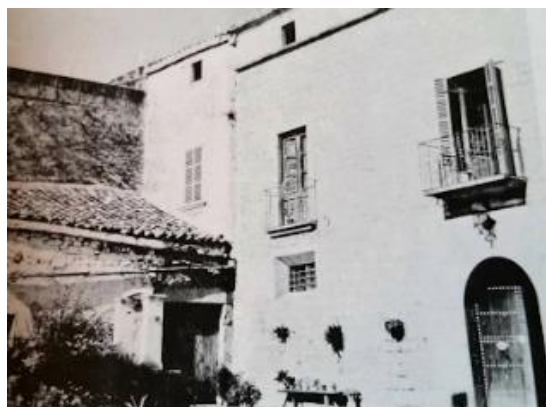
Fig 4. i Fig. 5.: Ca'n Antic.