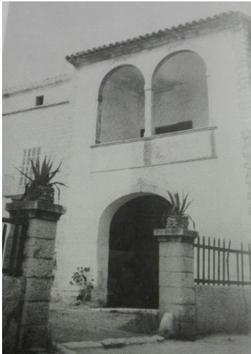
Fig. 15.: Ca'n Antic.