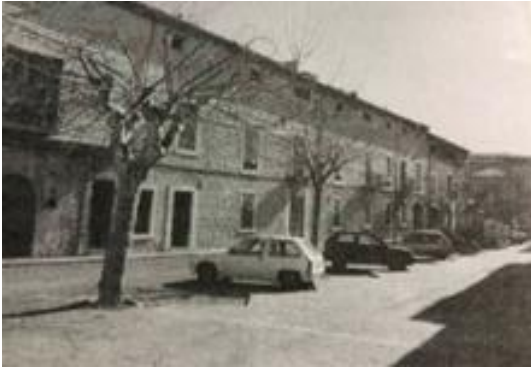
Fig. 21: Carrer Creu. Imatge cedida per Salvador