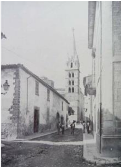
Fig. 22: Carrer Concepció.