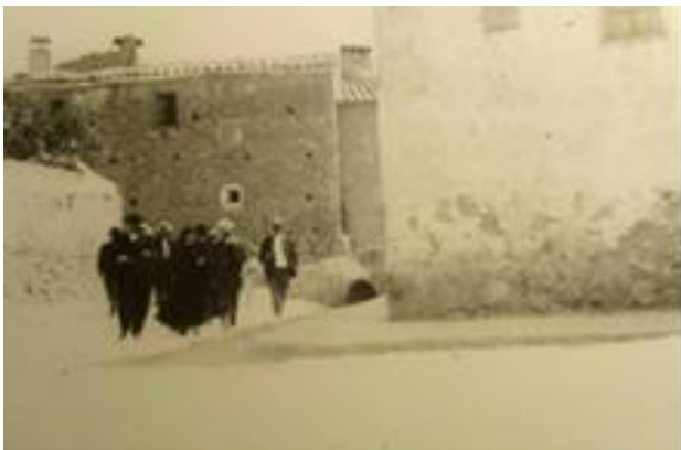
Fig. 19: Es Pontarró.