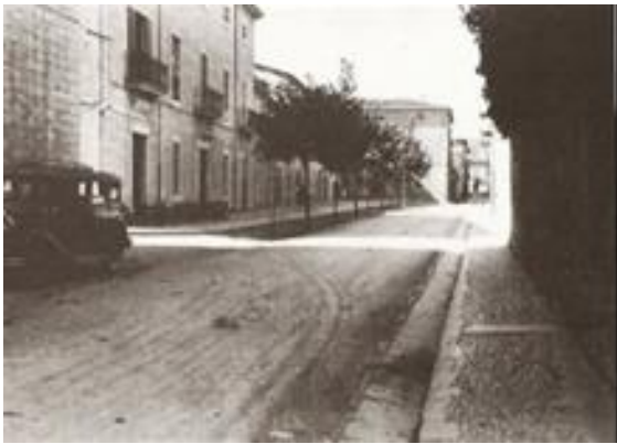
Fig.6.: Born. Extreta de Salom Pons, Jeroni (1995). Binissalem: imatges d'ahir . Palma. Miquel Font, p: 30.