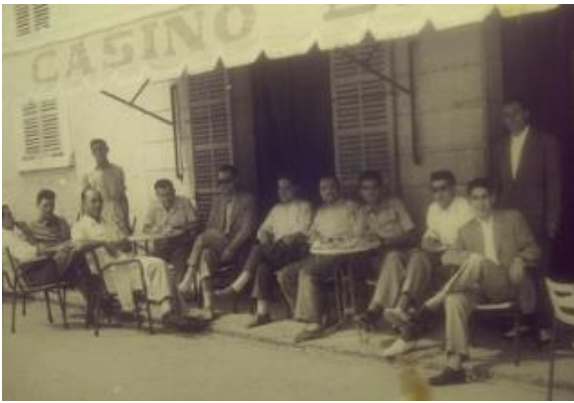
per Salvador Cànoves.