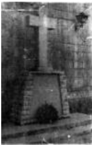
Fig. 20.: Creu dels caiguts. Revista Binissalem , nº 36, p:15.