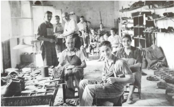
Fig. 12: Fàbrica de Sabates.