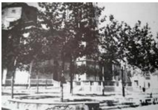
Fig. 1: Plaça de Binissalem. Extreta de Salom Pons, Jeroni (1995). Binissalem: imatges d'ahir . Palma. Miquel Font, p: 22.