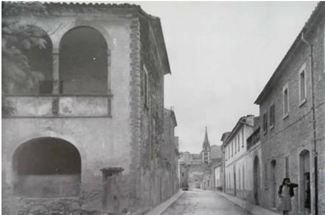
Fig. 18: Ca'n Antic.