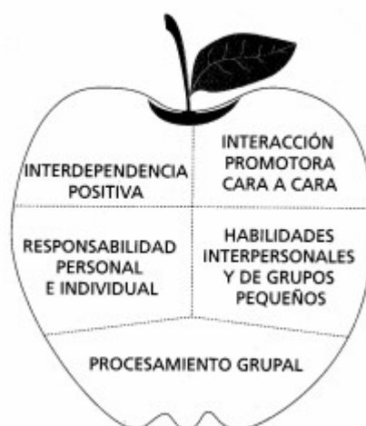
Il·lustració 2. Components essencials del treball cooperatiu.