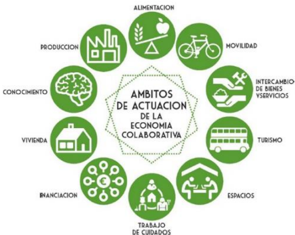
Ilustración 3 Los ámbitos de la EC (Elaboración propia)

Aparece economía colaborativa en diferentes ámbitos de actuación en los diferentes sectores: