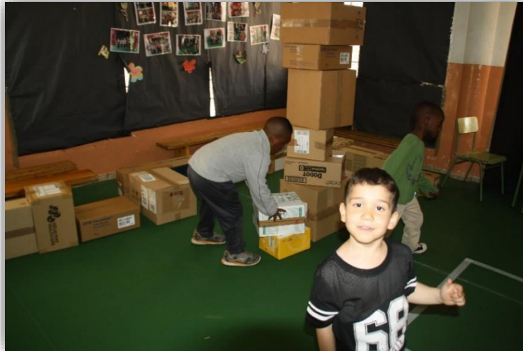
Els infants realitzant un edifici i una carretera

Una vegada finalitzada la sessió, vàrem xerrar amb els infants sobre les construccions que havien fet i amb qui les havien fet, i després vàrem construir una torre conjunta amb totes les capses de la sala i quan va estar muntada els infants la varen anar a tirar.