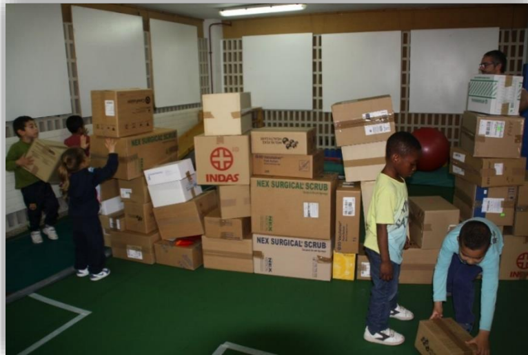
Els infants realitzant un castell

Després de la conversa ens vàrem dirigir a la sala de psicomotricitat i vàrem explicar als infants les normes bàsiques com no pegar o no destruir les construccions dels altres. Una vegada aclarides se'ls hi va dir als infants que havien de construir a les zones delimitades per construir una ciutat, i després varen començar.