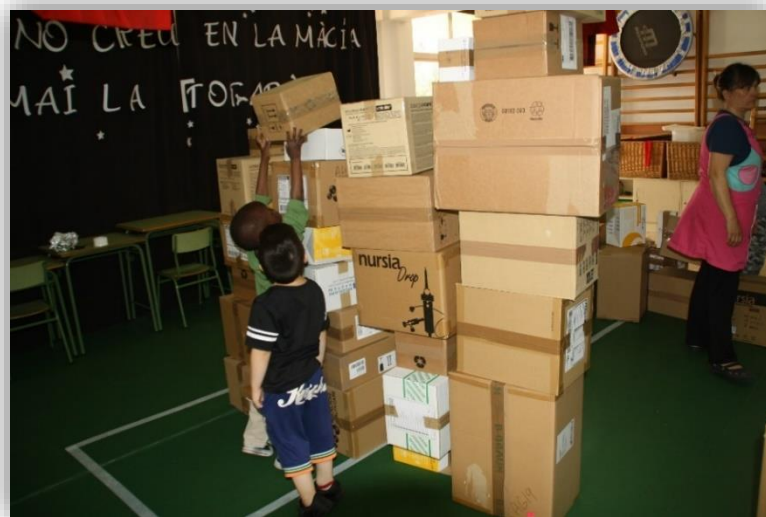
Els infants realitzant un palau