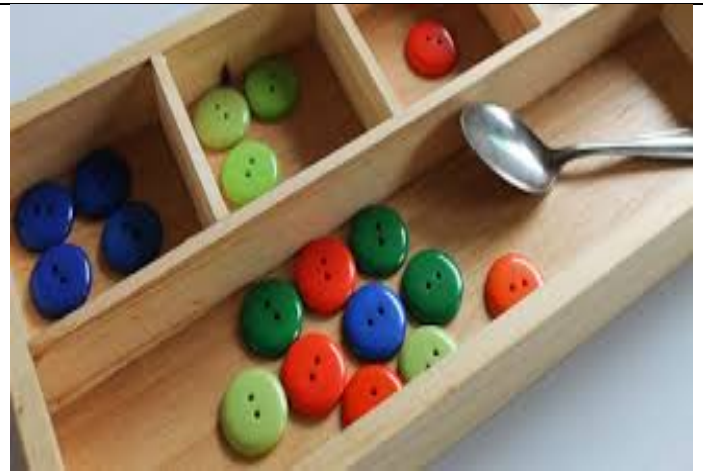
Fotografías 9 y 10. Espacio con material habilitado para trabajar matemáticas en Sa Nau (izquierda) y Material Montessori para trabajar diversas áreas (derecha).

Por lo tanto, mediante el juego e interacción con este tipo de material se promueven unos aprendizajes que son adquiridos de forma libre y activa por sus usuarios. Valga de ejemplo las imágenes de la parte superior, en las cuales, aparecen materiales que sirven para trabajar áreas como las matemáticas y la psicomotricidad fina entre otros.