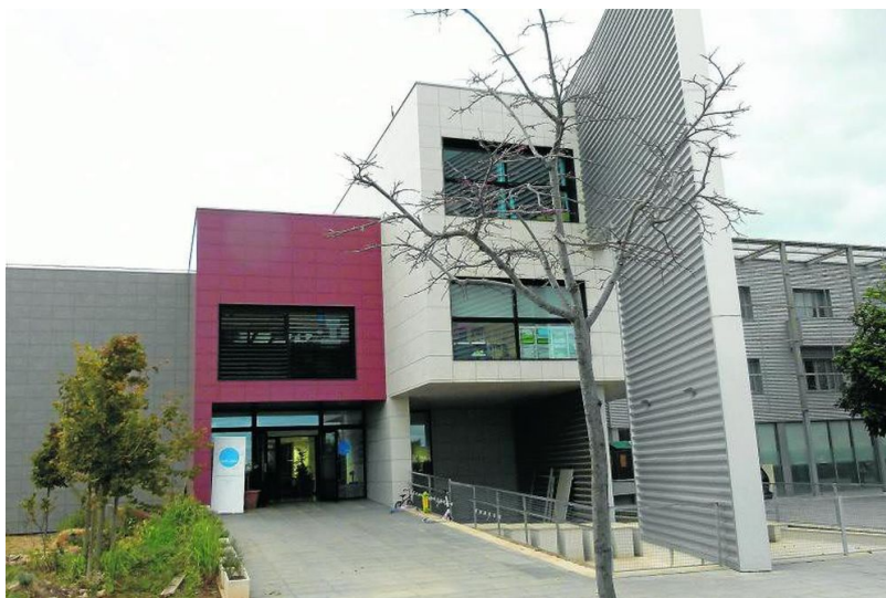
Fotografía 3. Escola Global.

La Escola Global ocupa un edificio de reciente creación. Concretamente se trata de un edificio de arquitectura moderna.