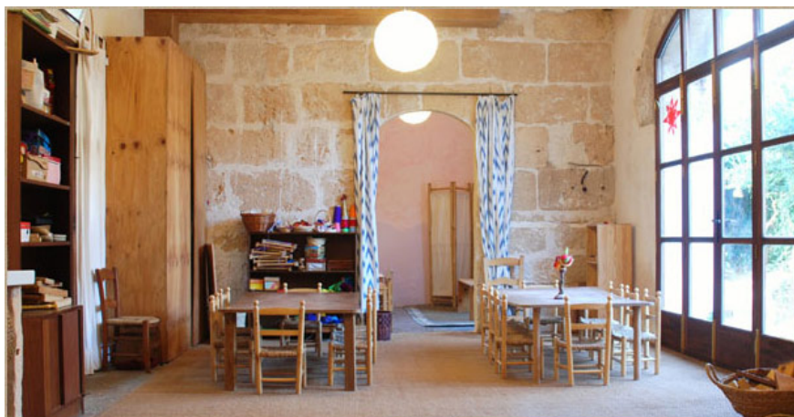
Fotografía 5. Interior de Sa Llabor.

Uno de los elementos que más llama la atención es el hecho de que las paredes son correderas, y permiten que se pueda separar o juntar los espacios. Esta característica de la permeabilidad de los espacios facilita la interacción entre diferentes grupos.