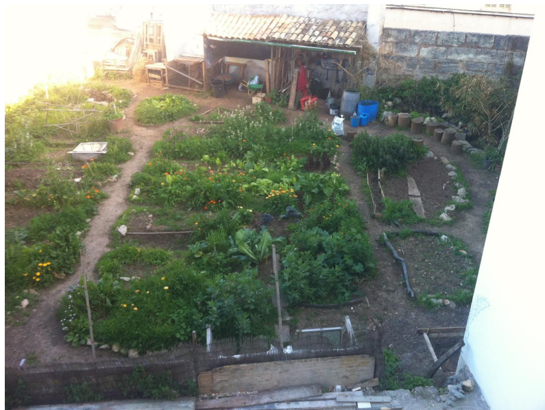
Fotografía 1. Huerto escolar de Sa Llabor

La escuela dispone de un gran huerto escolar donde los niños y niñas pueden trabajar aspectos relacionados con el desarrollo sostenible. Además, cerca de la escuela tienen también un bosque al que realizan salidas frecuentes para promover el contacto con la naturaleza.