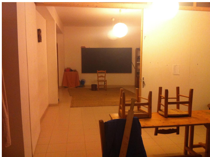
Fotografía 6. Interior de Sa Llabor.

Cabe destacar que Sa Llabor cuenta con dos edificios, uno de ellos destinado a los alumnos/as más mayores y el otro a los más pequeños.