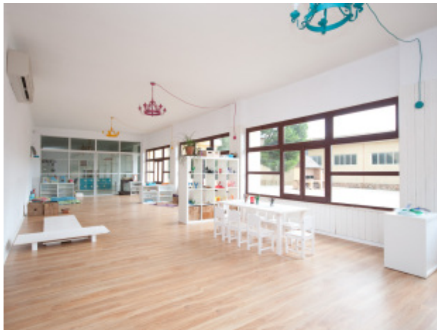
Fotografía 4. Interior de Nau Escola.

En el caso de Nau escola, se caracteriza por disponer de grandes salas –espacios- que facilitan la acción y mayor libertad de movimientos de los más pequeños. Además, el espacio interior cuenta con una cuidada y atractiva decoración y mobiliario favoreciendo un ambiente cálido y agradable. El uso de materiales como la madera y los colores claros son algunas de las particularidades de este centro. Además, cuenta con grandes cristaleras que ofrecen una sensación de amplitud e iluminación natural tal y como se puede observar en la imagen.