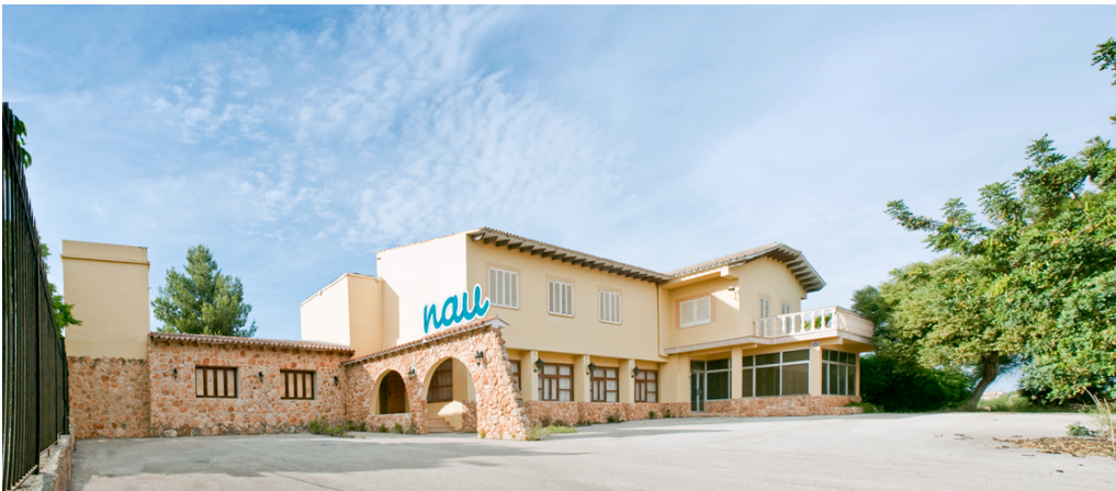
Fotografía 2. Nau Escola

En el caso de Nau Escola y Sa Llabor, ocupan un espacio reformado y habilitado para el uso de los diferentes grupos de edades que integran la escuela. Cabe destacar que a diferencia de las escuelas convencionales, estos dos centros son relativamente pequeños, ya que el número de alumnos también es menor.