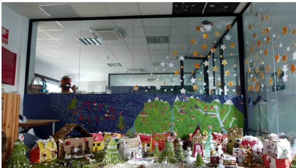
Fotografía 7. Interior de Escola Global.

Por su parte, Escola Global, cuenta con aulas y mobiliario muy nuevo. Llama especialmente la atención el hecho de que algunas de las aulas dispongan de grandes cristales interiores para separar el espacio de las zonas comunes. “Ningún aula es de pladur, sólo de cristal, esto también es muy interesante, si tu vas a entrar en un sitio, en una sala, no estás molestando, para ellos es normal porque se sienten integrados en el espacio” (Guido). Esta característica aporta más profundidad y luminosidad a las aulas.