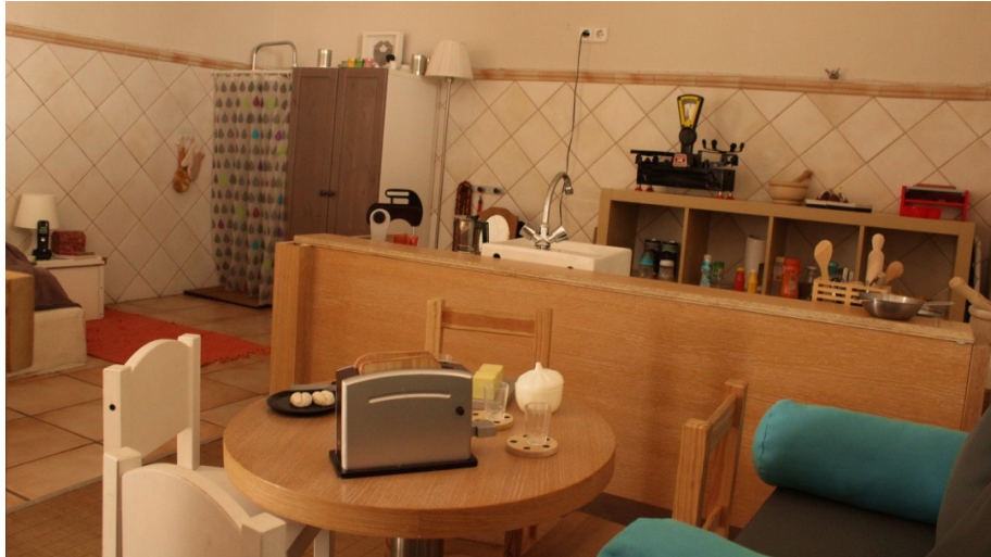
Imatge 2 Espai de joc simbòlic

Les professionals estan d'acord amb què els espais presentats i els espais en la primera infància en general han de ser espais que suposin reptes, que puguin ser llegits de maneres diferents perquè com esmenta Malaguzzi els infants, com els artistes, són capaços d'anar més enllà, de dotar de nou significat allò que l'envolta (Citat per Hoyuelos, 2004, p.5).