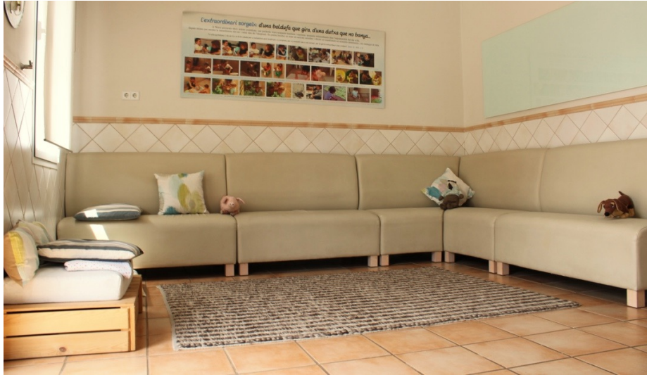
Imatge 1 Espai que acull el moment de l'arribada i comiat.

Aleshores, el programa PAFPI intenta adaptar-se no tan sols a les necessitats dels infants, adaptant els espais a una alçada adequada per poder facilitar el lliure moviment per l'espai sinó que alhora, intenta integrar i adaptar els espais a als adults ja que és la interacció entre ambdós uns dels focus claus d'observació en el programa.