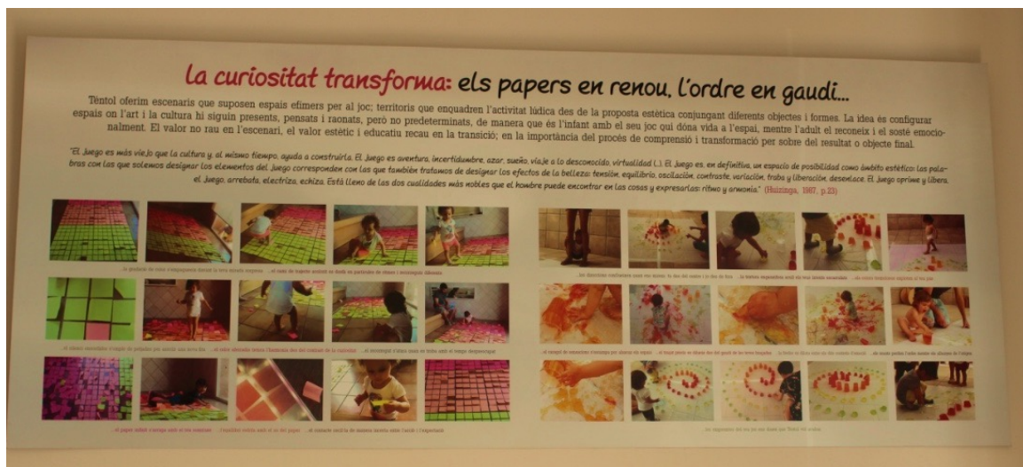
Imatge 4 Un dels plafons de documentació que es poden trobar

- Narració: La capacitat dels espais per poder expressar totes o gran part de les històries que s'han viscut en ell. Actua com a memòria mitjançant objectes, i sobretot, la documentació i informació amb imatges i paraules que l'acompanyin i condueixin a qui ho llegeixi a viure l'experiència presentada. Pel que fa als espais presentats, són un reflex de la utilització de la documentació, que segons Bonàs (2006), es tracta d'una eina per seguir el treball dels infants per conèixer i reconèixer i, alhora, permet mostrar-ho a fora, establir un diàleg amb les famílies i aprofundir el sentit de la comunitat. A més, cal dir que parlar de documentació és, també, parlar de visibilitat, de donar visió a l'exterior.