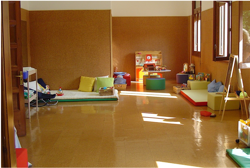
Imatge 5 Imatge d'un dels espais del programa, any 2004.