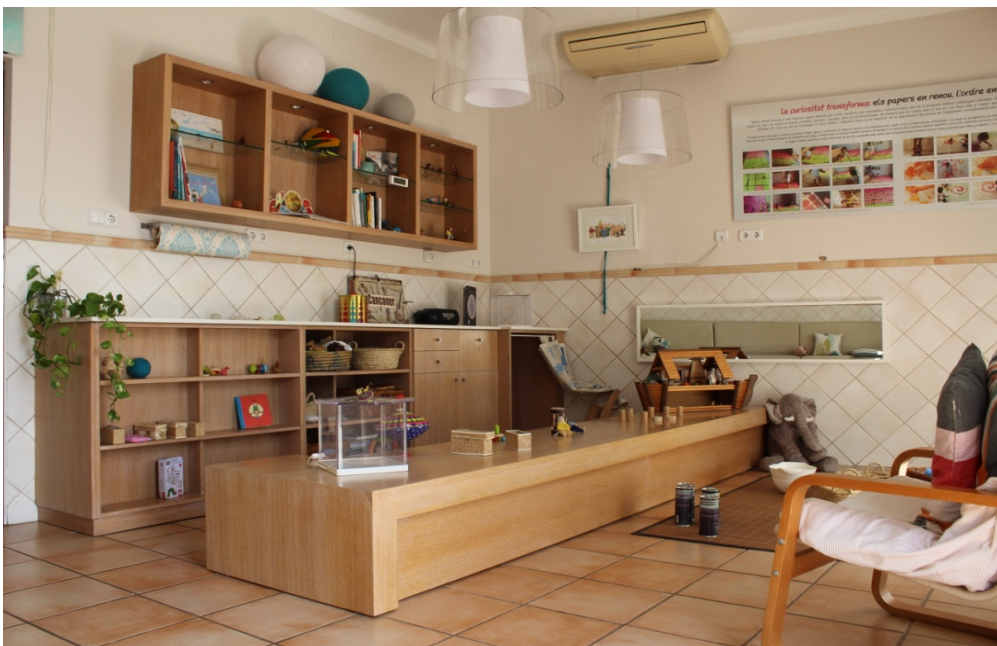
Imatge 3 Espai presentat per una sessió de PAFPI

- Epigènesis: “el espacio se transforma y se adapta a los proyectos de los niños y de los adultos, donde cada modificación promueve nuevas acciones y aprendizajes a partir de estructuras móviles con posibilidades de transformación, construcción-deconstrucción, escenarios de juego cambiantes, etc.” (Abad, n.d, p.3).