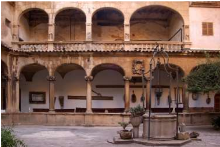
Fig. 6. Catedral de Palma. Claustre Barroc, Catedral de Palma Correspona a la unitat didactica 3,