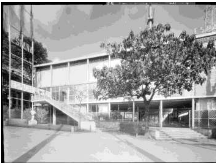
Fig. 8. Pavelló de la República. Exterior Correspon a la unitat didactica 5, Fonts: Fotografia François Kollar, Ministère de la culture (France), Médiathèque de l'architecture et du patrimoine, diffusion, RMN http://www.mediatheque-patrimoine.culture.gouv.fr/fr/archives_photo/visites_guidees/expo_1937.html [Consulta: 28/05/2017]