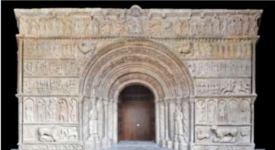
Fig. 3. Portalada Romànica de l'església del monestir de Santa Maria de Ripoll. Correspon a a la unitat didactica 3