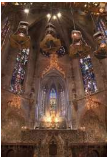
Fig. 4. Capella de la Santíssima Trinitat. Correspona a la unitat didactica 3