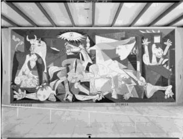
Fig. 7. Guernica . Pablo Picasso. 1937. Interior del Pavelló de la República. Correspon a la unitat didactica 5