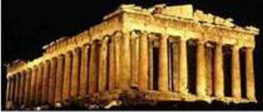
Fig. 1. Partenó. V a. C. Acròpolis d'Atenes. Correspon a la unitat didàctica 1, Font: Guia de grècia

http://www.guiadegrecia.com/atenas/partenon.html