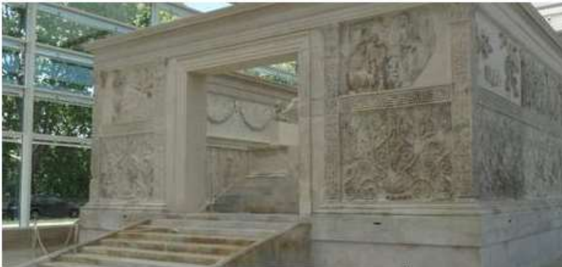
Fig. 2 Ara Pacis Font: Museu de l'ARA PACIS, Roma . Correspona a la unitat didàctica 2, Font: Web del museu de l'Ara Pacis

http://es.arapacis.it/percorsi/esterno2 [ Consulta : 26/05/2017]