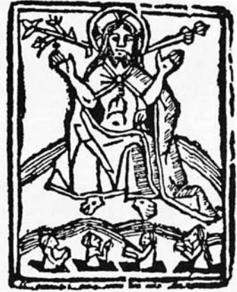
Est. 12. Obra del menyspreu del mon en cobles . Cansoles. Mallorca. 1540. Colofó