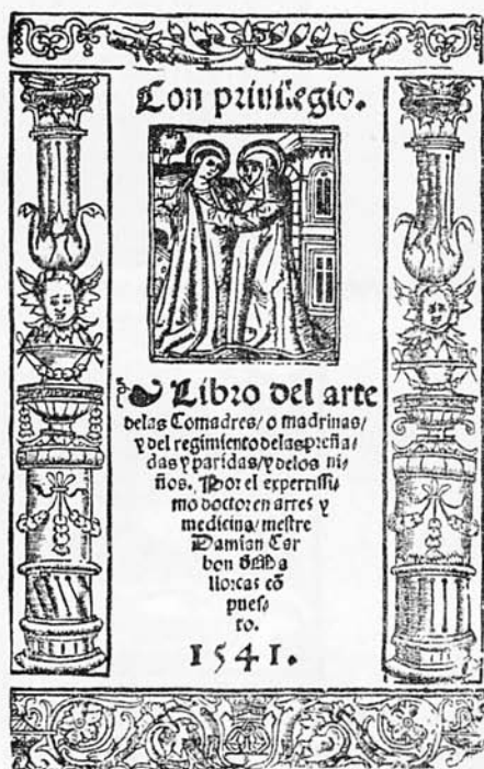
Est. 6. Libro del Arte de las Comadres . Cansoles. Mallorca. 1541. Portada