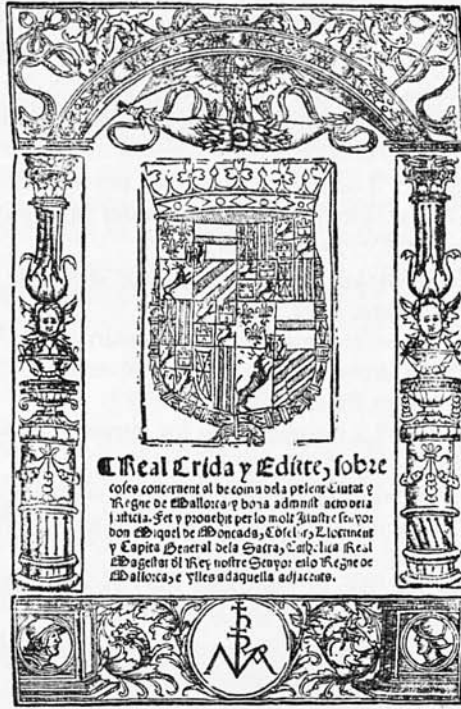
Est. 1 Real Crida y Edicte, sobre / cosas concernent al be comu dela present Ciutat y / Regne de Mallorca y bona administració dela / justicia... Cansoles. Mallorca. 1576. Portada