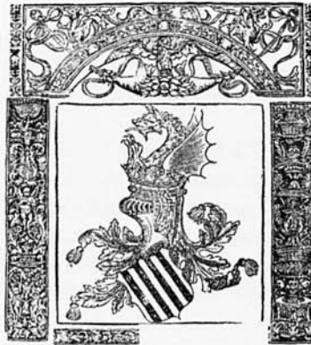
Est. 2. Fori Regni Valentiae , Juan de Mey. València. 1548. Portada volta