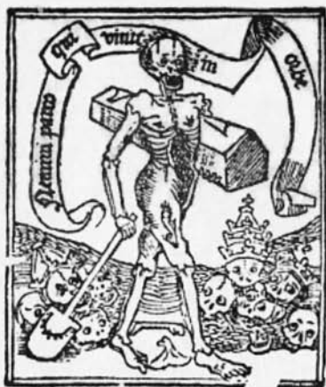
Est. 9. ESCOBAR, Andrés. Arte de Confesar . Estanislao Polono. [Sevilla]. 1500. Colofó