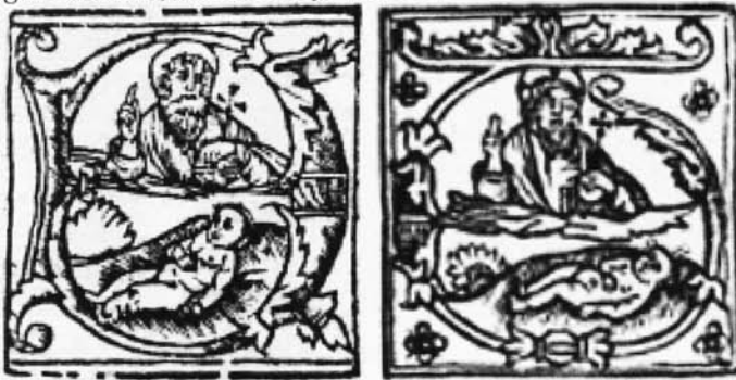
Est. 4. Lletres inicials del Libro del Arte de las Comadres (Cansoles. Mallorca. 1541) i de Blanquerna (Joan Joffre. València. 1521)