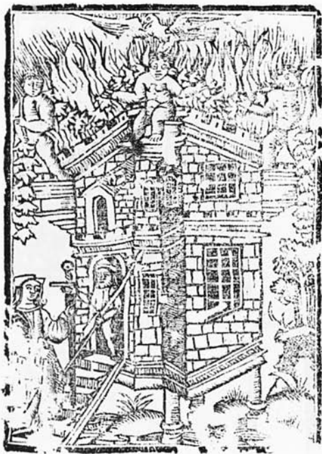
Est. 14. Xilografia que il·lustra un imprès publicat per Gabriel Guasp. Palma. 1621.