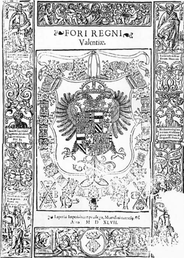
Est. 3. Fori Regni Valentiae , Juan de Mey. València. 1548. Portada