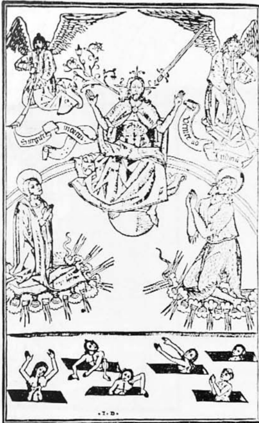
Est. 13. Missale Mixtum . Arnao Guillén de Brocar. Navarra. [1498-1500]. Il·lustració