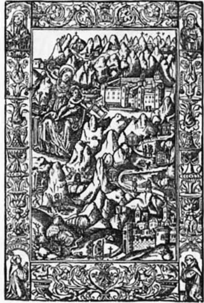
Est. 7. Lectionarium Sanctonale . Joan Rosembach. Montserrat. 1524. Portada