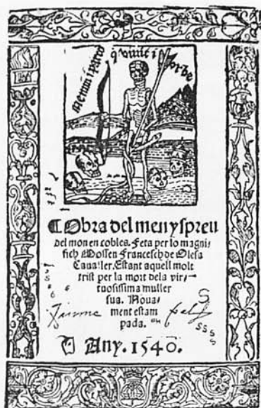
Est. 5. Obra del menyspreu del mon en cobles . Cansoles. Mallorca. 1540. Portada