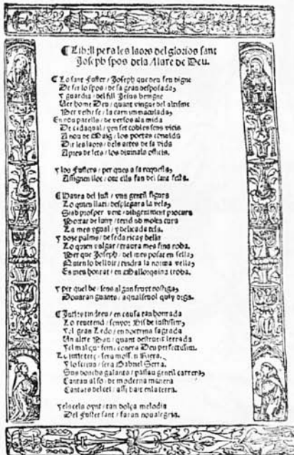
Est. 8. Libell pera les laors del glorios sant Joseph dela Mare de Deu [Cansoles. Palma. 1561-1572]