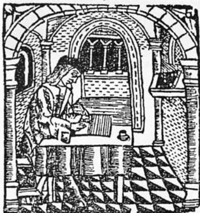
Est. 10. Obra del menyspreu del mon en cobles . Cansoles. Mallorca. 1540. Il·lustració