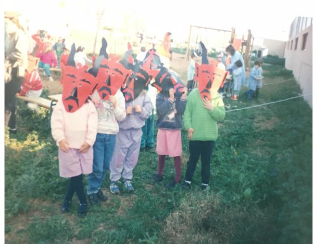
Sant Antoni 2002 – 2003