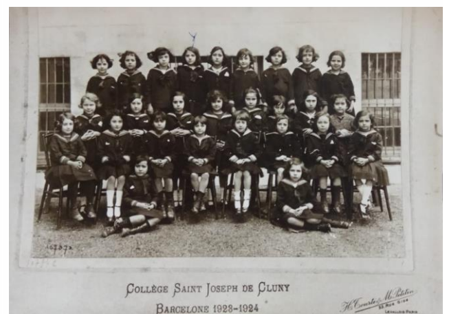
COLLÈGE SAINT JOSEPH DE CLUNY BARCELONE 1923-1924