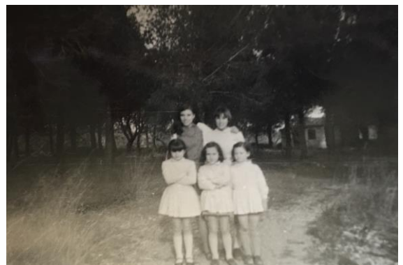
D'excursió II 1967 – 1968 Les Trinitàries (Binissalem)