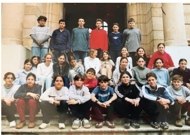
Nens i nenes 2005 – 2006