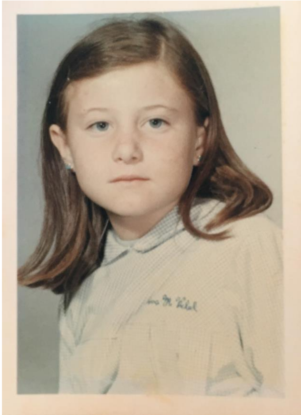
Catalina Maria II 1970 – 1971 La Caritat (Binissalem)