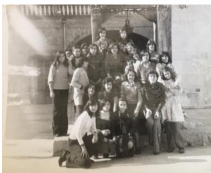
D'excursió III 1973 – 1974 La Caritat (Binissalem)