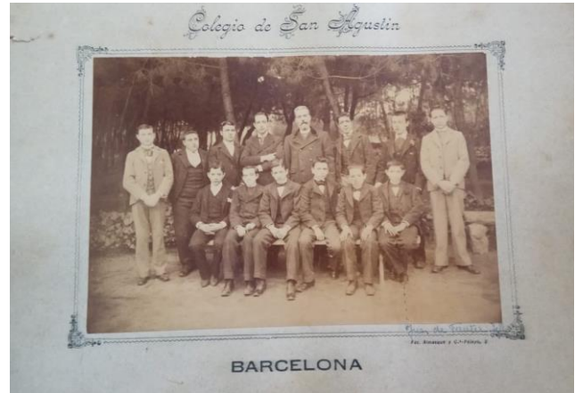
Els nens 1905 – 1906 Colegio de San Agustín (Barcelona)