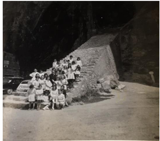
D'excursió I 1967 - 1968 Les Trinitàries (Binissalem)