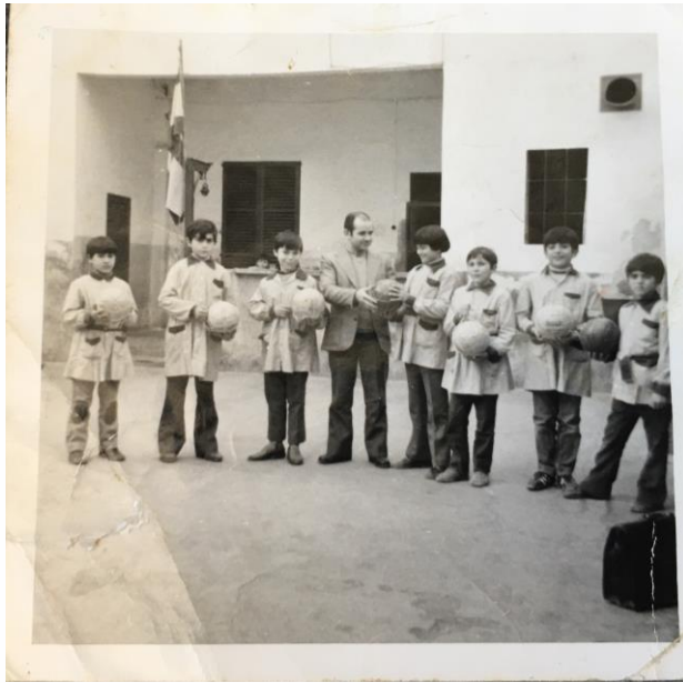
La pilota 1968 – 1969