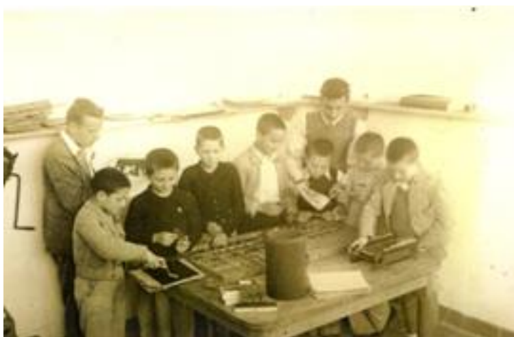
Figura 05 - Alumnos de Son Espanyolet trabajando en la imprenta escolar, curso 1940-41. (DEYÁ, 1941, p. 33).