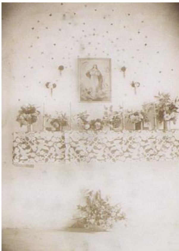
Figura 01 – Celebración del Mes de María. (NOLLA, 1950, p. 11).