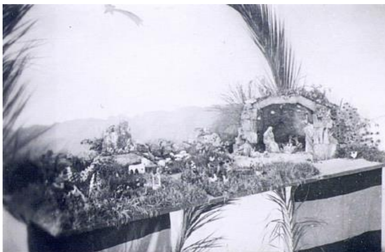
Figura 03 - Belén escolar. (NOLLA, 1950, p. 11).