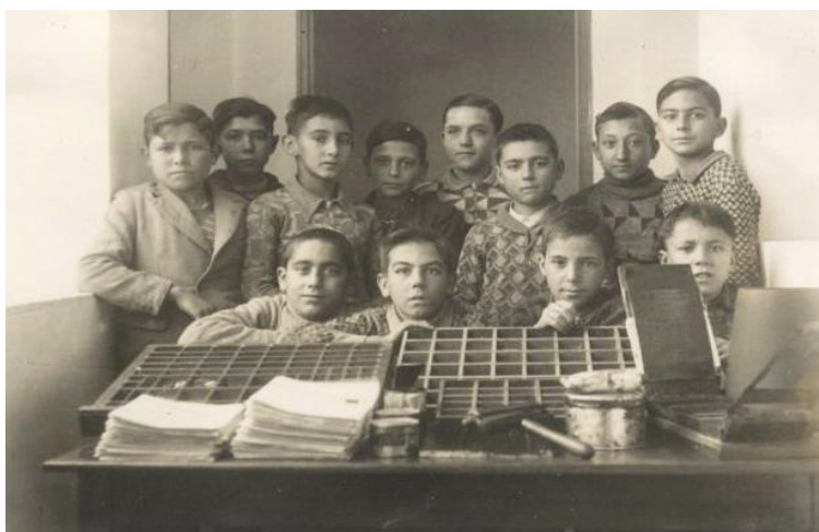
Figura 04 - Alumnos de la escuela de Consell en 1934 junto a la imprenta escolar. (DEYÁ, 1941, p. 14).

este caso, estaban confeccionando el primer número de la revista Letras publicado en mayo de 1941.