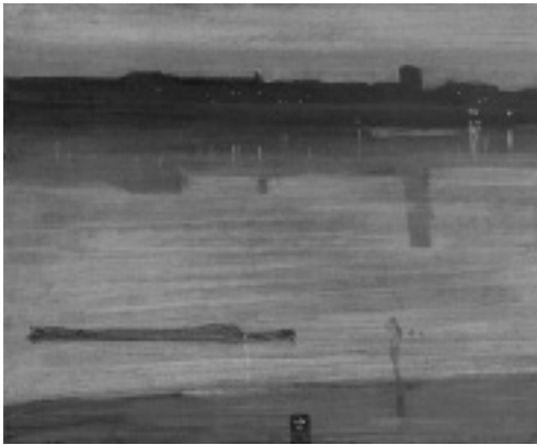
Whistler: Nocturne in Blue and Silver-Chelsea , 1871 (Tate Gallery, Londres).