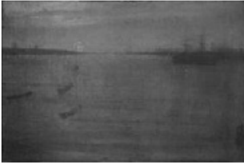
Whistler: Nocturne Blue and Gold, Southampton Water , 1872 (The Art Institute of Chicago).