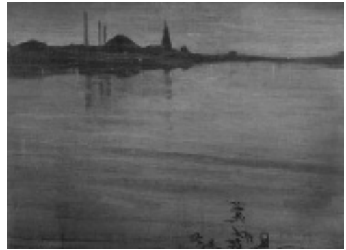
Whistler: Nocturne Blue and Silver - Cremorne Lights , 1872 (Tate Gallery, Londres).