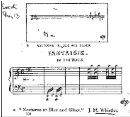
Fig. 2. Caricatura del Nocturne in blue and silver-Cremorne Lights de Whistler, reproducida en el catálogo de la exposición celebrada en 1882 en la Grosvenor Gallery y posteriormente publicada en Society , 13 de mayo de 1882. Recogida en el catálogo de la exposición Turner. Whistler. Monet . Katharine Lochnan (ed.). Londres: Tate Publishing, 2004, p. 152.

los críticos su insistencia en la vinculación literaria de la plástica a través de la temática 56 .