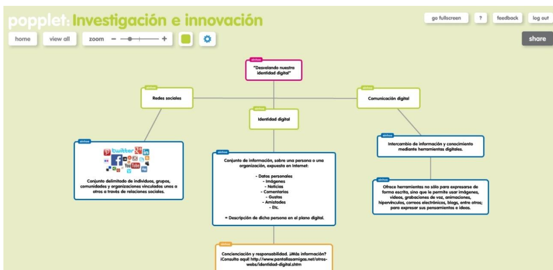
Figura 4: mapa conceptual creado con Popplet .

Como se puede apreciar en la figura 3, a pesar de que la aplicación está en lengua inglesa, la interfaz de Popplet es muy intuitiva. La finalidad de esta es crear mapas conceptuales, como decíamos, tales como el siguiente: