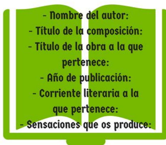
Figura 1: actividad inicio de cada sesión.

Una vez que se lea el fragmento seleccionado por el/la docente, o mientras se lee, los alumnos, además, deberán responder por cuenta propia, dejándose llevar por aquello que les suscita la lectura, a la última pregunta.