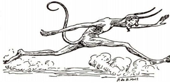
Imatge extreta de Llegendes de Mallorca, llegendes de la Mediterrània . https://uom.uib.cat/digitalAssets/263/263871_5.pdf