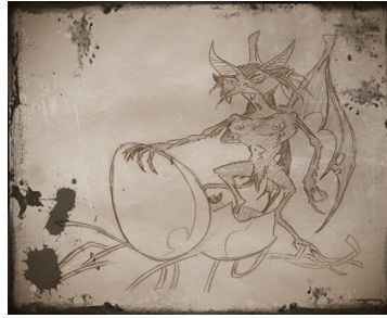
Imatge extreta de la pàgina Els éssers fantàstics de la nit de Sant Joan.

http://janonimar.blogspot.com/2012/06/els-essers-fantastics-de-la-nit-de-sant.html