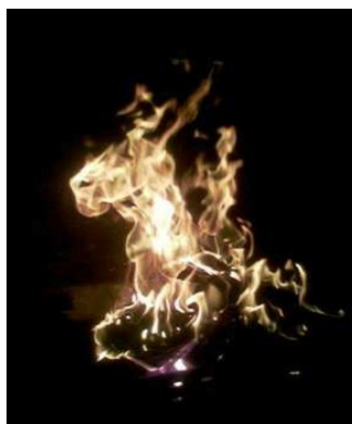
Imatge extreta de Llegendes de Mallorca, llegendes de la Mediterrània . https://uom.uib.cat/digitalAssets/263/263871_5.pdf