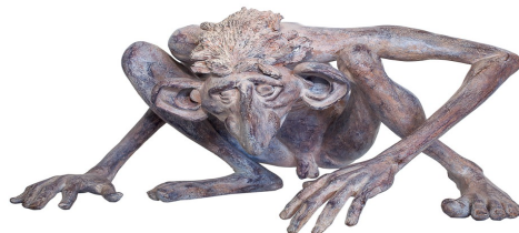
Escultura d'Andreu Moreno.

Els fameliars únicament es poden trobar a les illes d'Eivissa i Formentera. La majoria d'històries que se'ns conten dels fameliars d'Eivissa, s'han transmès de manera oral fins avui dia.