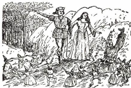
Imatge extreta de Llegendes de Mallorca, llegendes de la Mediterrània .

«Hala homonets i donetes, veniu tots a treballar! I zas! compareixen dos estols d'homonets i donetes de colzada, menudois, remolests, que pareixia que tenien argent viu dins els cos, i venguen bots, xecalines, cucaveles i tombarelles» (Alcover, 1991,VI:38)