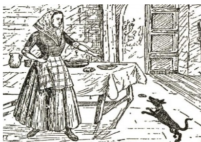
Imatge extreta de la rondalla Es Negret . Il·lustració de Moll.

tienen la capacidad de tomar muchas formas y cambiar su apariencia a seres humanos, animales o incluso a torbellinos. Según la creencia popular, los Djinn generalmente suelen adaptar la forma de un perro negro o de un gato negro, que eran considerados antiguamente como emisarios del diablo.» (MEP, març del 2015)