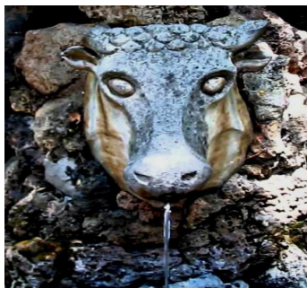
Imatge extreta de la Llegenda de la Font del Vedell d'or. https://fontsaigua.wordpress.com/2016/11/26/la-llegenda-de-la-font-del-vedell-dor/