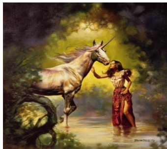
Imatge extreta de la pàgina de Mitologia fantàstica: http://usuaris.tinet.cat/ffborras/m2/index.htm

«L'homo, perdut de tot, se posa darrera sa soca d'un pi. S'animal, amb sa fua que duia, no es pogué returar; amb sa banyota pega en aquella soca, i la s'hi aficà un forc i mig, i va romandre enrocat. Don Martín se treu un guinavet, i guinavetades a s'animal p'es pits i per sa panxa! Al punt el va tenir mort; li va rompre sa banyota amb una pedra.» (Alcover, 1995, I:46)