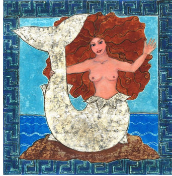
Il·lustració d'Anna Ribot-Urbita, al Calendari 2017 de mitologia catalana