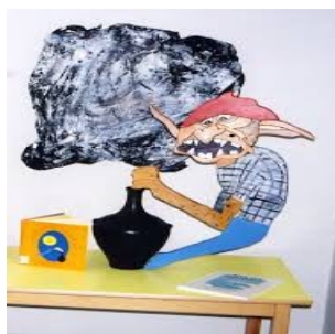
Imatge extreta de Els nostres personatges mitològics .

« Una vegada, a sa vénda d'es Vedrà d'es Marins ( que avui és de Sant Josep) hi havia un pou que, segons diuen, hi habitava un barruguet molt entremaliat que no tenia sossego i era sa causa de molts de desaforos.. De vegades es penjava a sa corda i ses dones no podien salpar el poal quan anaven a treure aigua. D'altres, ses mules no volien beure dins sa pica perquè es barruguet els feia quècos de dins s'aigua i els feia por. I d'altres, es penjava a qualsevol cosa que un es volgués carregar damunt s'espatala o a s'esquena, tant si era un cistelló de figues, una garba o un feixet de llenya, i no hi havia qui ho fes moure ni ho pogués portar ni aixecar d'en terra. Era més empipo que sa picor.» (Castelló, 1993:18)