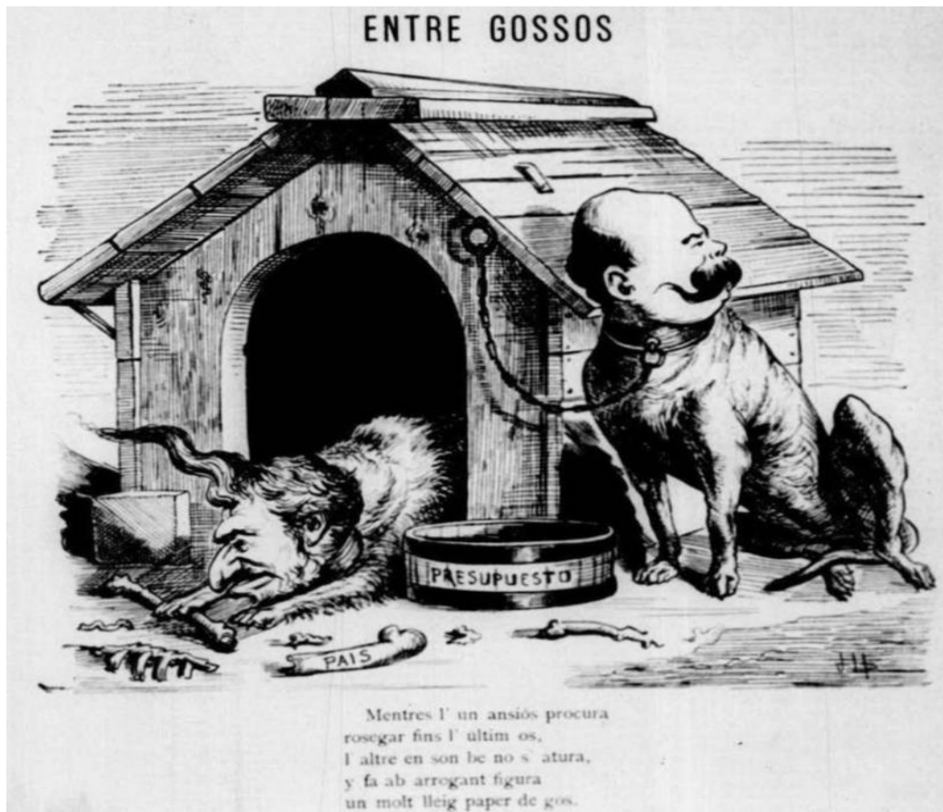
Il·lustració 3: Llompart, J: “Entre Gossos”. La Tramontana , VIII, nº 349, 17 de febrer de 1888, pàg. 1.