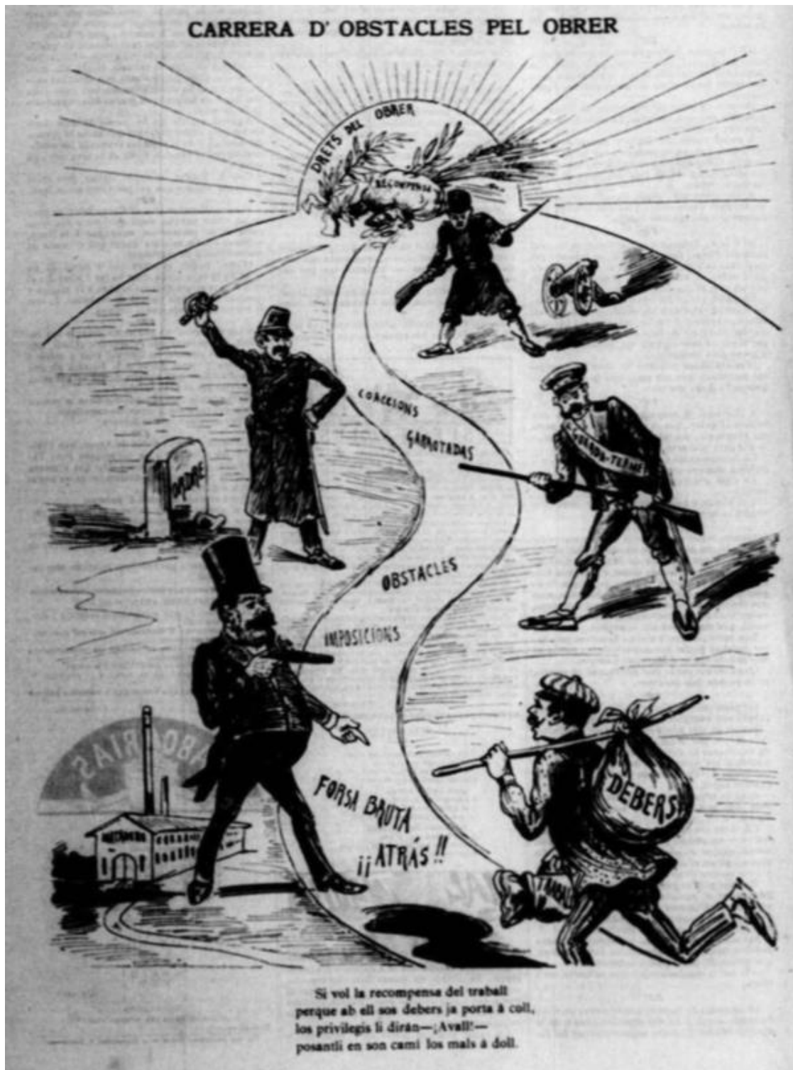
Il·lustració 5: “Carrera d’obstacles pel obrer”. La Tramontana , X, nº 476, 12 de setembre de 1890, pàg. 4.