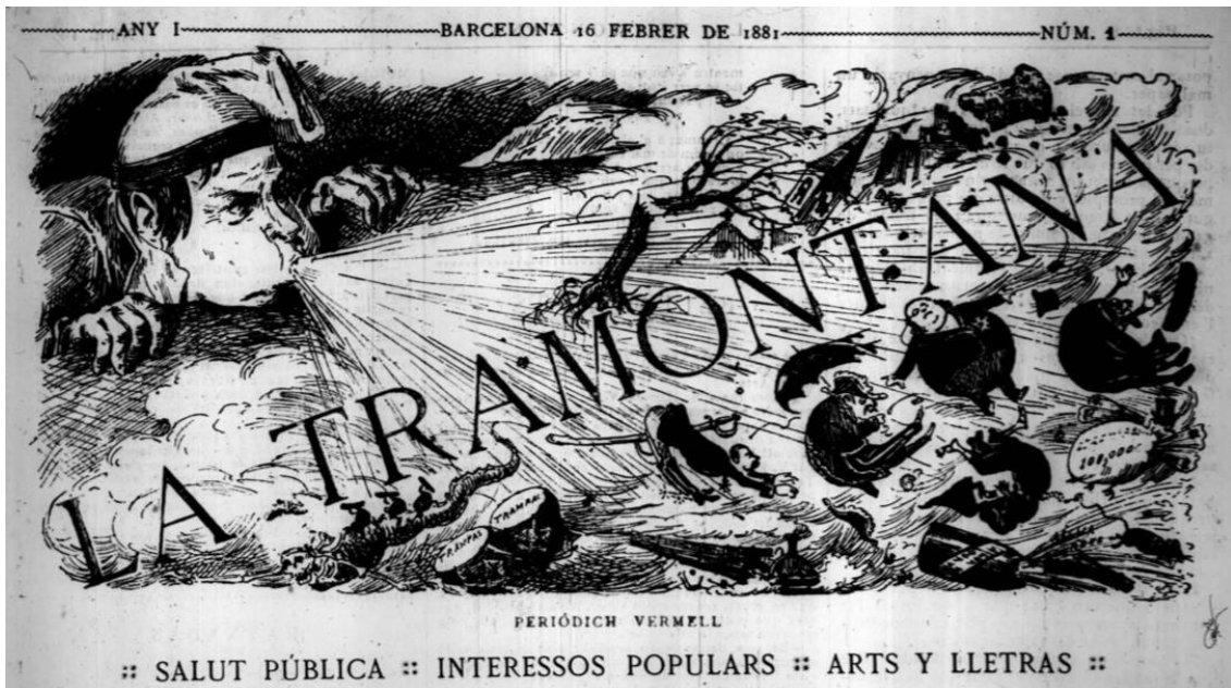
Il·lustració 1: La Tramontana , I, n° 1, 16 de febrer de 1881