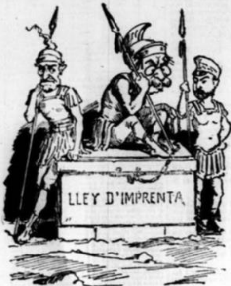
Morta y freda aquí reposa tenida en aquesta llosa, oh veu! y emsig la guarden y ja molta cups s' hi acobarden perque son crim los imposa.