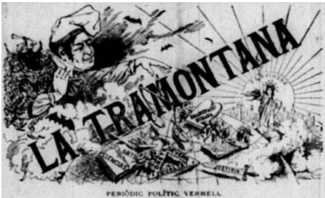
Il·lustració 2: La Tramontana , XV, n° 670, 19 de juliol de 1895