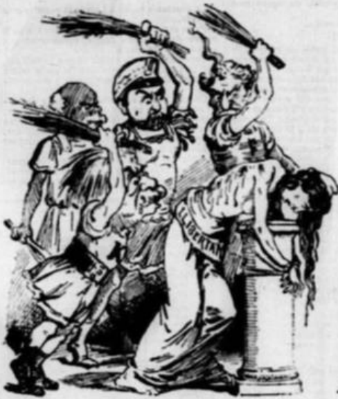
La Llibertat estimada volen veure condemnada tots aquells vils seynors, que sens admetre reborns la deitzen ben assejada.