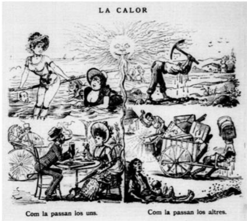
Il·lustració 6: “El calor”. La Tramontana , VII, nº 314, 24 de juny de 1887, pàg.1.