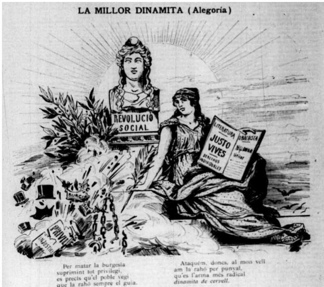
Il·lustració 10: “La Millor Dinamita (Al·legoria)”. La Tramontana , XIII, nº 625, 21 de juliol de 1893, pàg. 1.