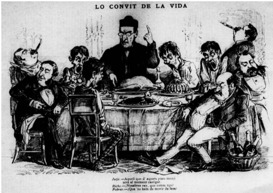
Il·lustració 9: “Lo convit de la vida”. La Tramontana , VI, nº 284, 26 de novembre de 1886, pàg. 4.