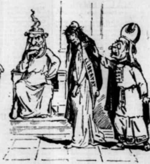
La pobreta Llibertat va d' Herodes a Pilat, los quals dician la sentència lliuyant entre sa consciència y 'l foll instant de maldat.