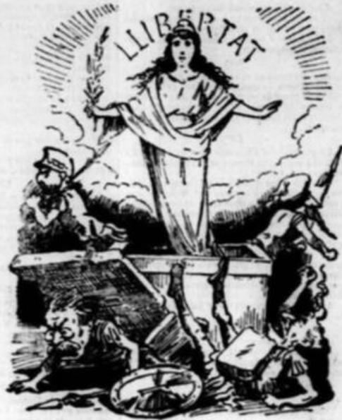
Tothom cau! Quin cabussó fan son al perdre 'l turró! Tal com los profetas deyan, ha vingut quen menos creyan la triomfant Resurrecció.