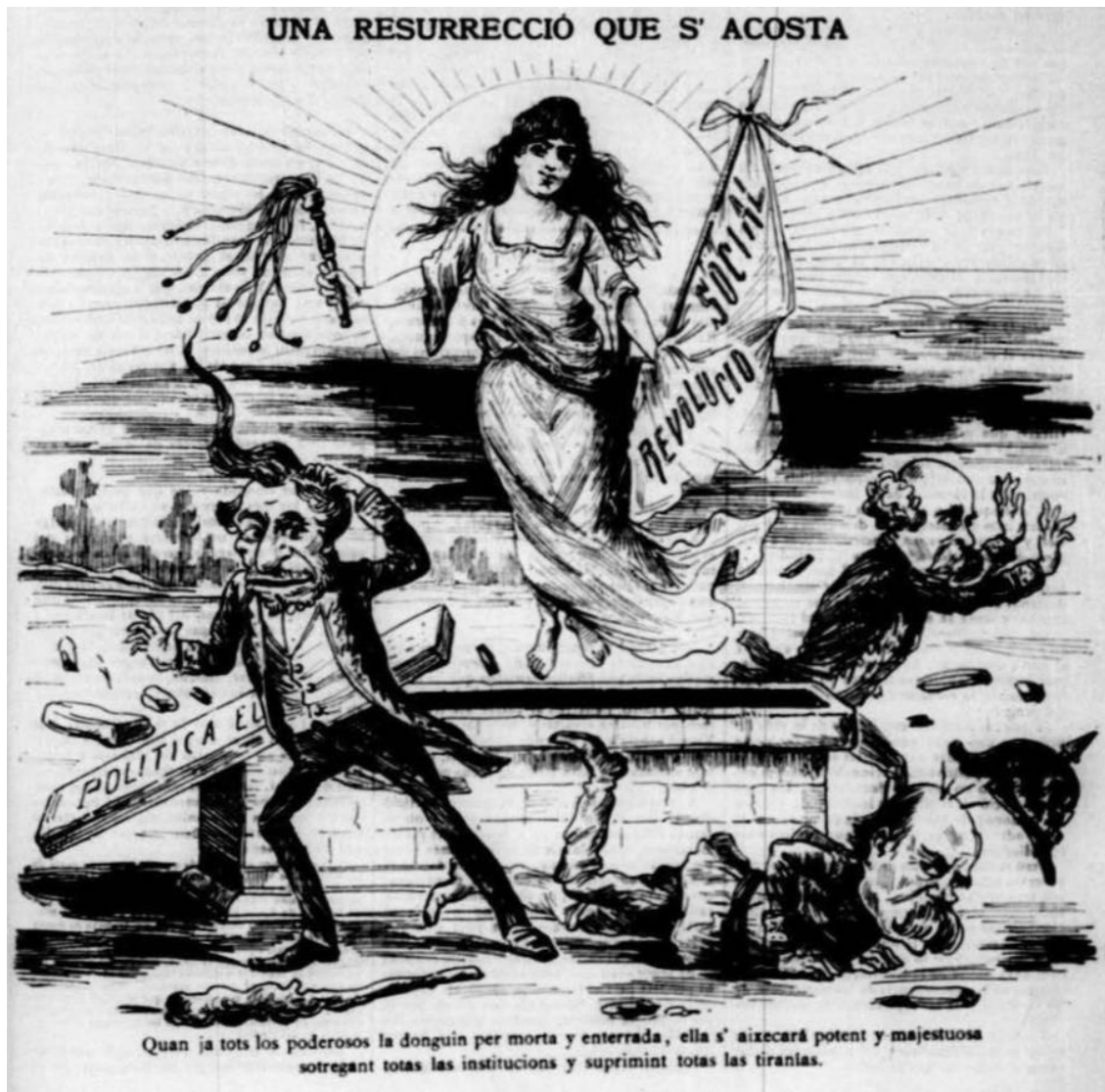
Il·lustració 4: “Una resurrecció que s’acosta”. La Tramontana , X, nº 460, 4 d’abril de 1890