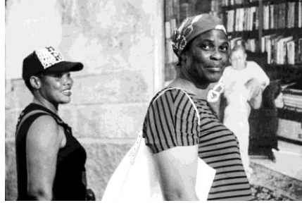
3. Detalle de L'avi i n'Ona ( El abuelo y Ona ), calle Lluís Martí, 115, Palma. Marina Molada Miró