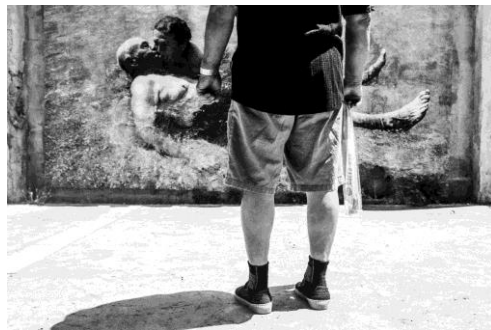
5. Laureano ( Laureano ) Plaça Sebastià Mas Crespo, Can Pastilla. Marina Molada Miró