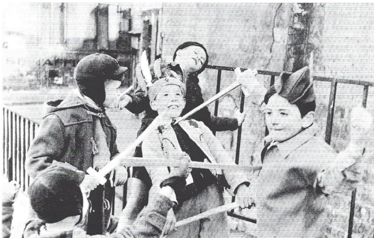
París, 1954.

Jugant esdevenim individus creadors, desenvolupem l'enginy, la imaginació, la reflexió i la capacitat d'esforç i de relació. El joc implica una comunicació que inclou una interacció cultural recíproca. Quan juguem ens expressem, però alhora ens veiem con-