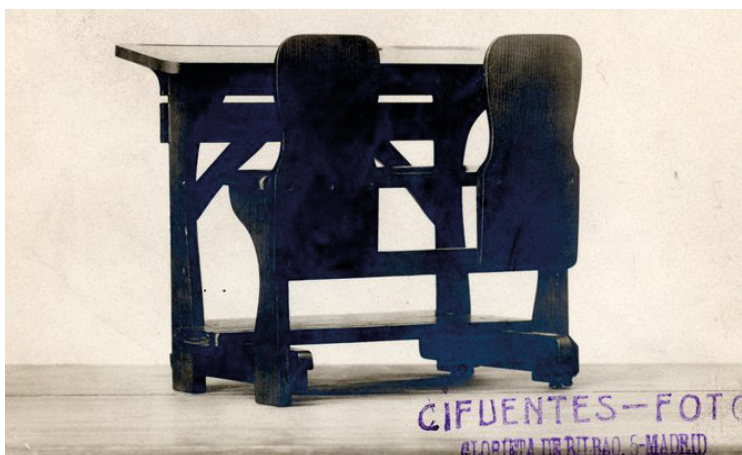
Imagen 3 - El modelo alemán Rettig