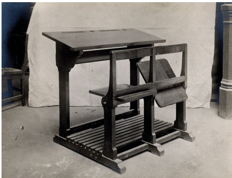
Imagen 5 - El modelo ya propuesto por el Museo Pedagógico Nacional