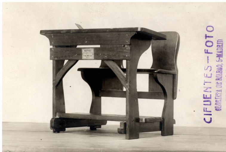
Imagen 2 - El modelo alemán Rettig