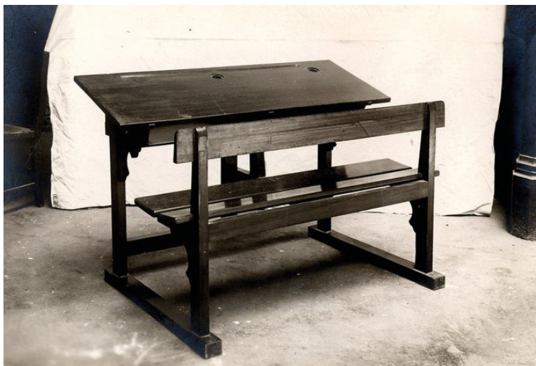
Imagen 4 - El modelo de Paris