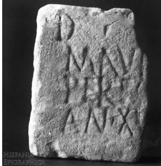
Imatge 3: Epitafi de Maurus, 150-250 dC, Almería.

http://eda-bea.es/pub/record_card_2.php?refpage=%2Fpub%2Fsearch_select.php&quicksearch=maurus&rec=34