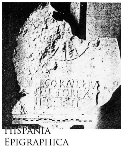
Imatge 2: Estela de L. Cornelius Sorex, Segle I, Albacete.

http://eda-bea.es/pub/record_card_2.php?refpage=%2Fpub%2Fsearch_select.php&quicksearch=liberto&page=3&rec=2919