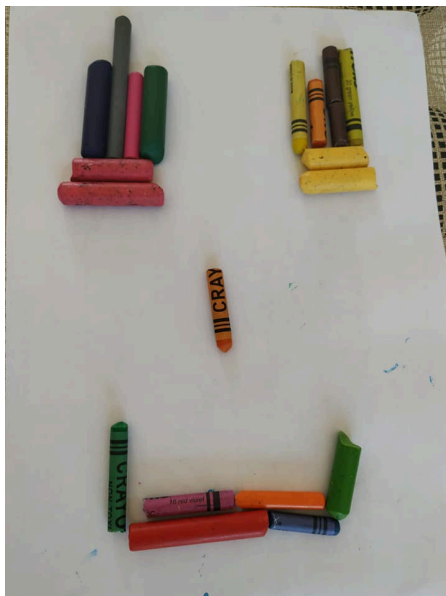
Il·lustració 1. Retrat #CREA+. Font: Facebook Biblioteca Santa Margalida

Ha tingut una repercussió que no m'esperava, ha estat compartit 9 vegades cosa que indica que s'ha fet una difusió de la publicació. En canvi, no hi ha hagut una gran participació. Aquests són les fotografies compartides a la xarxa social.