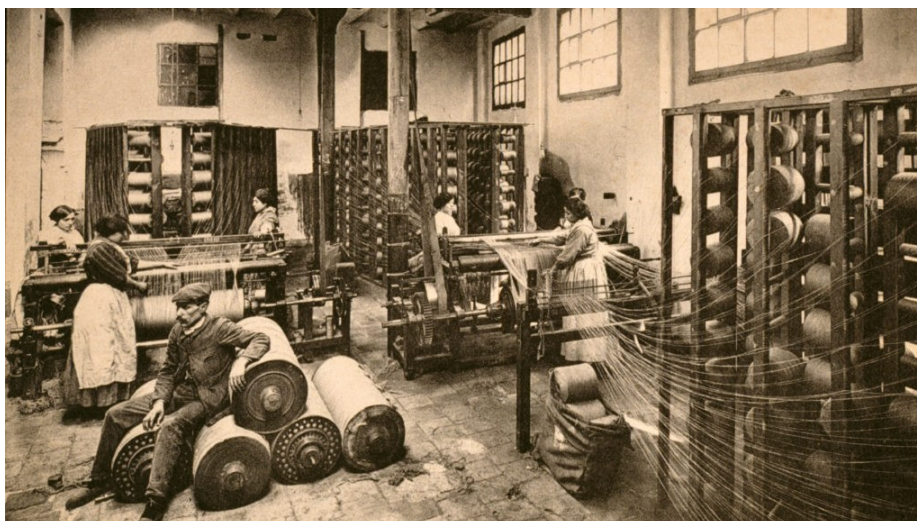
Figura 1: Secció de preparació del teixit de jute de la fàbrica de Can Saladrigas.

Els salaris eren molt baixos, quasi bé no arribaven a cobrir les necessitats per la seva pròpia subsistència. Aquest fet implicava una major dependència respecte l'espòs i la impossibilitat de desenvolupar una vida còmoda i plena en solitari (Medina, 2014, p.157- 158).