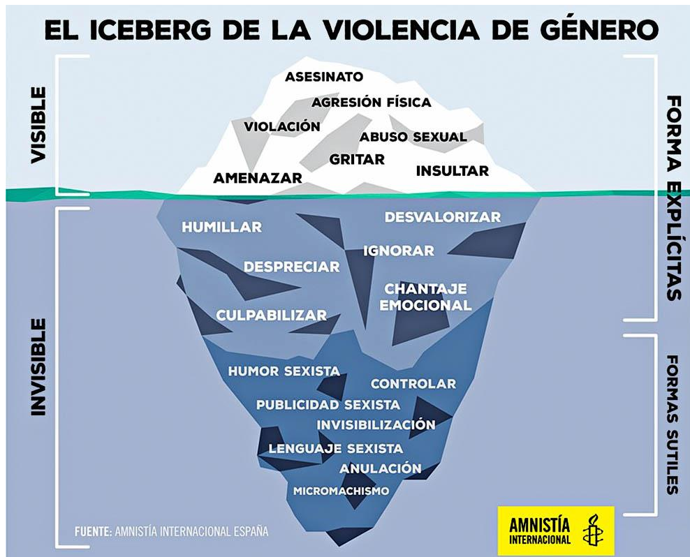
Il·lustració 1: Infografía Iceberg de la violència de gènere. (Amnistía Internacional., 2020).

A la punta de l'iceberg, la part més visible, l'assassinat apareix a la cúspide seguit de l'agressió física, la violació, l'abús sexual, les amenaces, crits i els insults. Però aquesta només és la part que es veu, per sota hi ha el col·lectiu d'accions que no es veuen ni es detecten a simple vista i que formen un bloc major: la infravaloració de la dona, la humiliació, la negligència, el menyspreu, el xantatge emocional, culpabilitzar i per si encara sembla poc més avall hi ha les formes subtils i invisibles de la violència masclista. Aquestes són: El control, la publicitat dels mitjans de comunicació sexista, la invisibilització de la dona, el llenguatge sexista, l'anul·lació i finalment els micromasclismes.