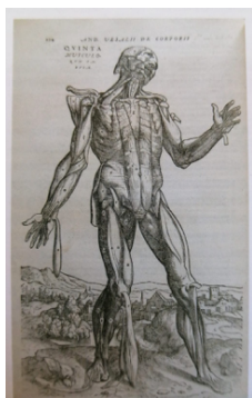
Imatge 1. Josep Miquel Vidal H. et al. Imatge anatomia dels músculs, XVIII: Història de la medicina I, (Enciclopèdia de Menorca, 2017), pàg 11.