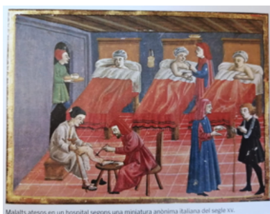
Imatge 2. Josep Miquel Vidal H. et al. Malalts atesos en un hospital segons una miniatura anònima italiana del segle XV, XVIII: Història de la medicina I, (Enciclopèdia de Menorca, 2017), pàg 15.