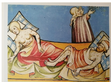
Imatge 4. Josep Miquel Vidal H. et al. Malalts infectats de pesta bubònica, segons miniatura de la Bíblia de Toggenburg (1411), XVIII: Història de la medicina I, (Enciclopèdia de Menorca, 2017), pàg 16.