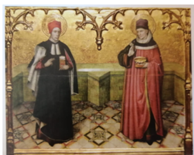
Imatge 3. Josep Miquel Vidal H. et al. Sant Cosme i sant Damià, coneguts com els sants metges, éren els patrons i advocats dels oficis relacionats amb la medicina durant l'edat mitjana i la moderna, també a Menorca. Fragment del retaule dels sants Abdó i Senén de Jaume Huguet (1460), de l'església de Sant pere de Terrassa, XVIII: Història de la medicina I, (Enciclopèdia de Menorca, 2017), pàg 17.