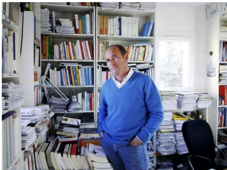
Font: Le Nouvel Observateur 52

En analitzar el problema polític, es rebel·la contra el discurs dels representants, legitimat per la ciència política, de que no tenen poder. Opina que no és cert que els poders estiguin afeblits. El problema no és que la política s'hagi tornat impotent davant l'economia. I ho justifica observant que la policia, l'exèrcit o l'administració de justícia continuen obeint la llei. També contradiu a aquells que donen més importància a la incompetència que a la corrupció. Seguint l'observació d'Alain, “L'elit, perquè està destinada a exercir el poder, també estan destinada a ser corrompuda per l'exercici del poder. Estic generalitzant; hi ha excepcions.” (1985), Chouard opina que “Els polítics no són incompetents: són intel·ligents i corruptes; fan