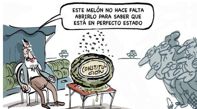
Imatge 4. Obrir el meló constitucional