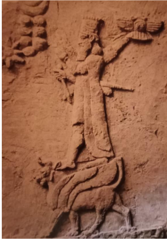
Font: Comte, Op. Cit. , 161.