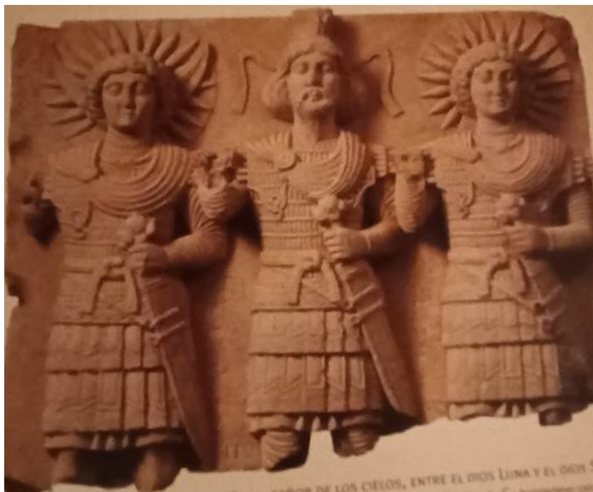
Font: Ibid. , 160.