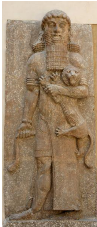
Imatge 1. Baix-relleu que representa a GuiL GaMeiX sostenint un lleó.

Font: Enrico Ascalone, Mesopotàmia (Barcelona: Electa, 2005), 15.