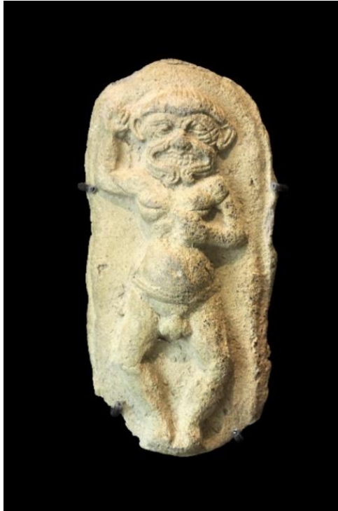
Font: Comte, Op. Cit. 162.