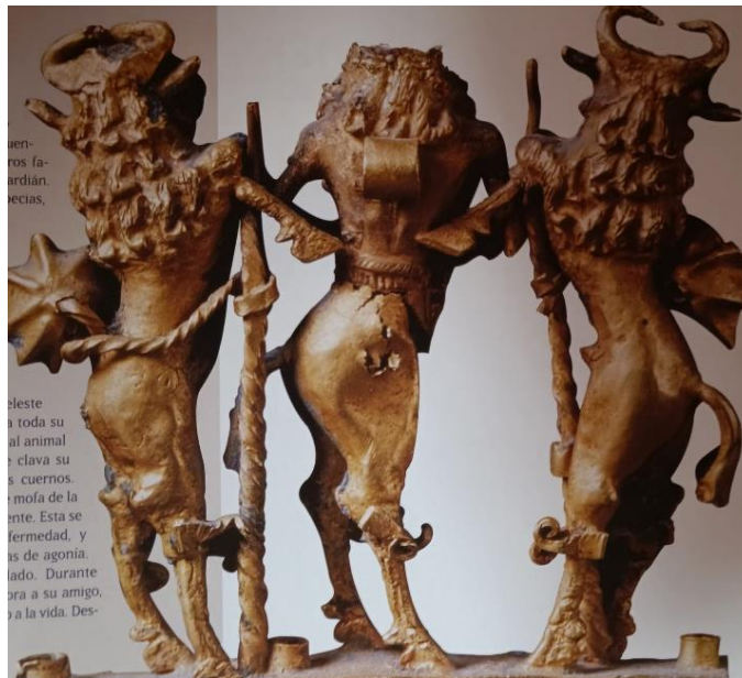
Font: Ibid. , 163.