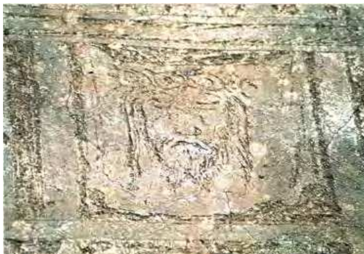
Fig. 6.- y 7.- Visión parcial y detalle del esgrafiado de la farmacia-portería.