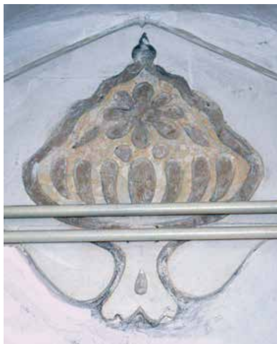
Fig. 3.- y 4.- Esgrafiados de la hospedería de nobles.