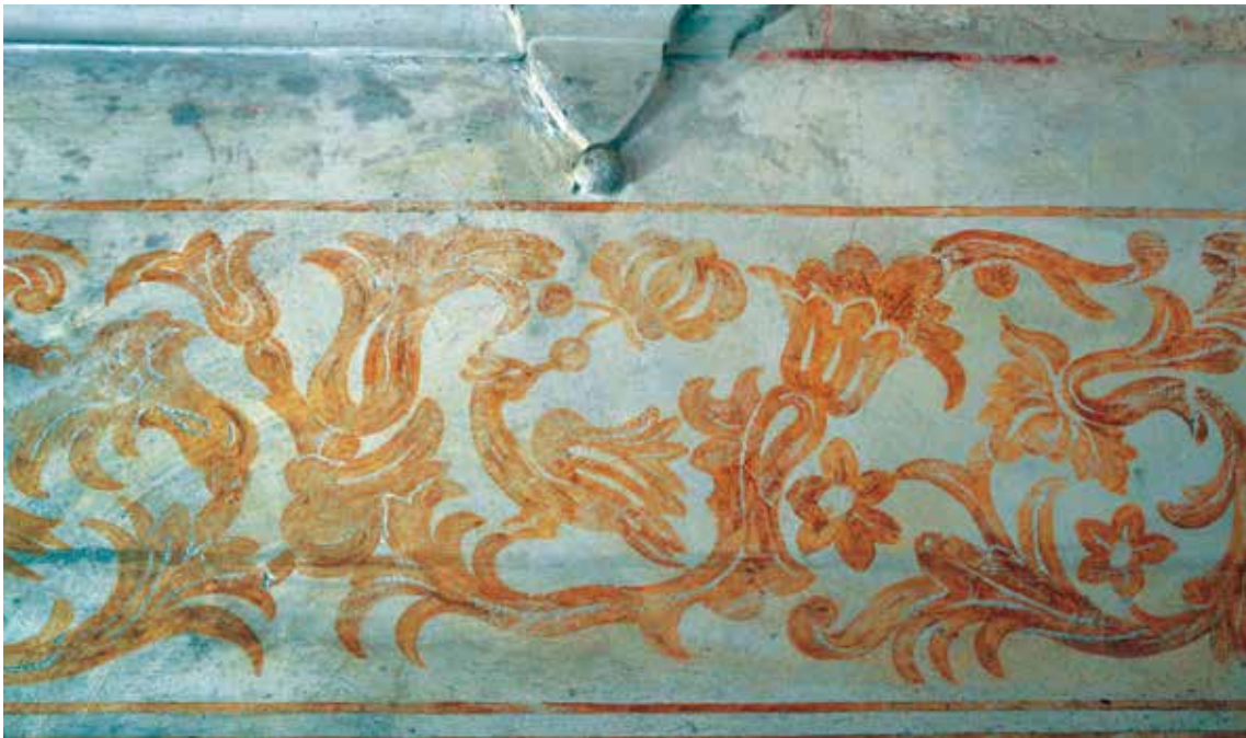
Fig. 1.- y 2.- Fragmentos del friso esgrafiado del hospicio de mujeres. Recreación de B. Ferrà, 1932.