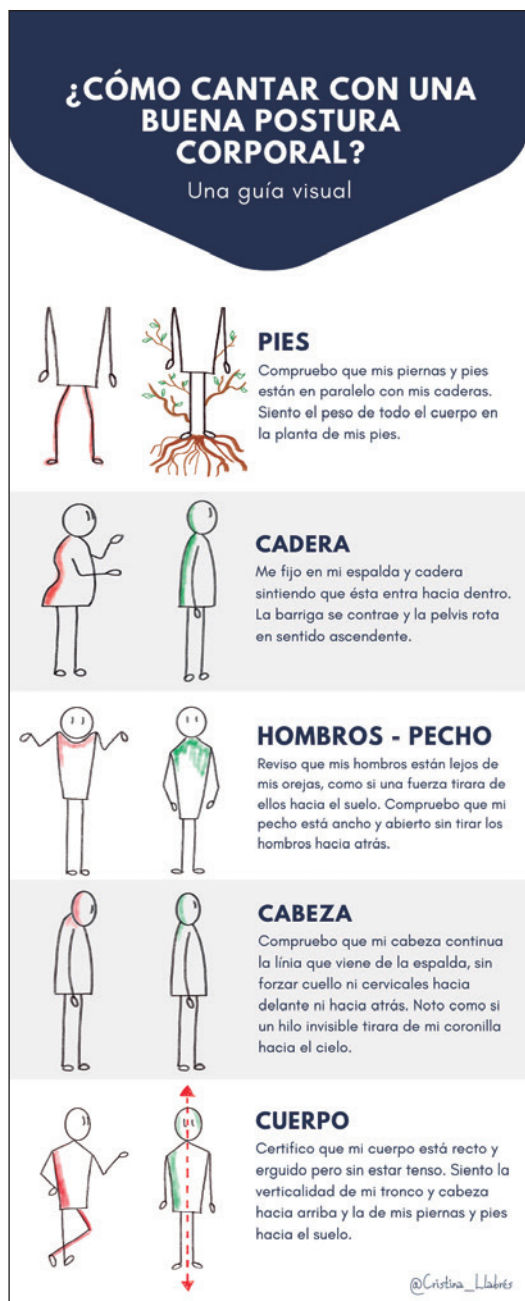
Imagen 3. Infografía. ¿Cómo cantar con una buena postura corporal?