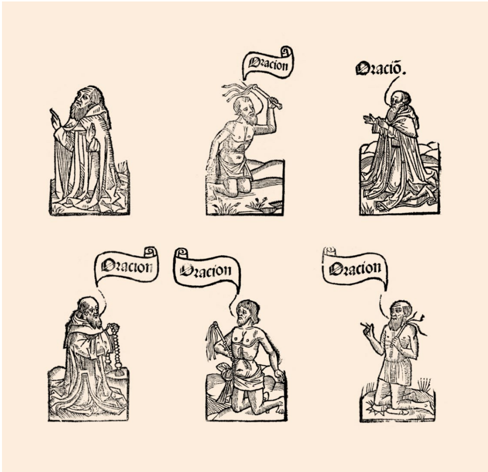
Fig. 6. Los seis modelos de orantes que aparecen en la primera edición del Thesoro de la passion (1494).