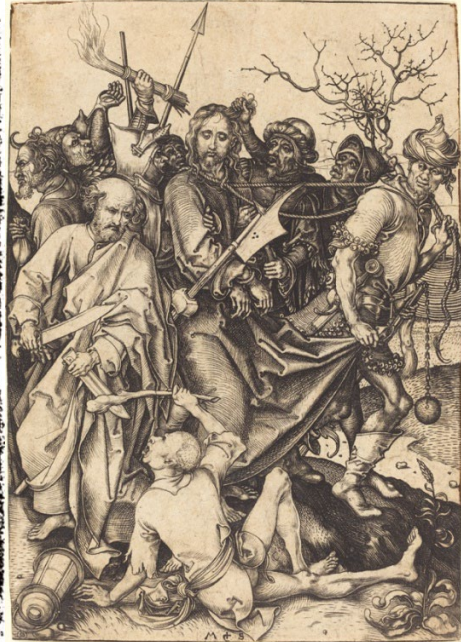
Fig. 7. Figs. 8. El prendimiento. Thesoro dela passion , 1494: XLIIIv, XLVIr, LIr / 1496-98: fol XLv, XLIIr, XLVIv.