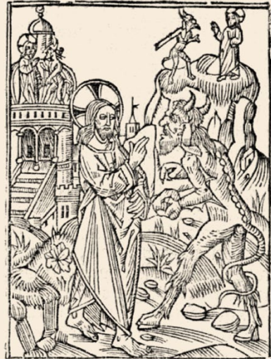
Fig. 4 y 5. Tentación en el desierto. Comparativa entre la representación de la primera y la segunda edición del Thesoro dela passion , 1494: fol. Xr / 1496-98: fol. Xr.