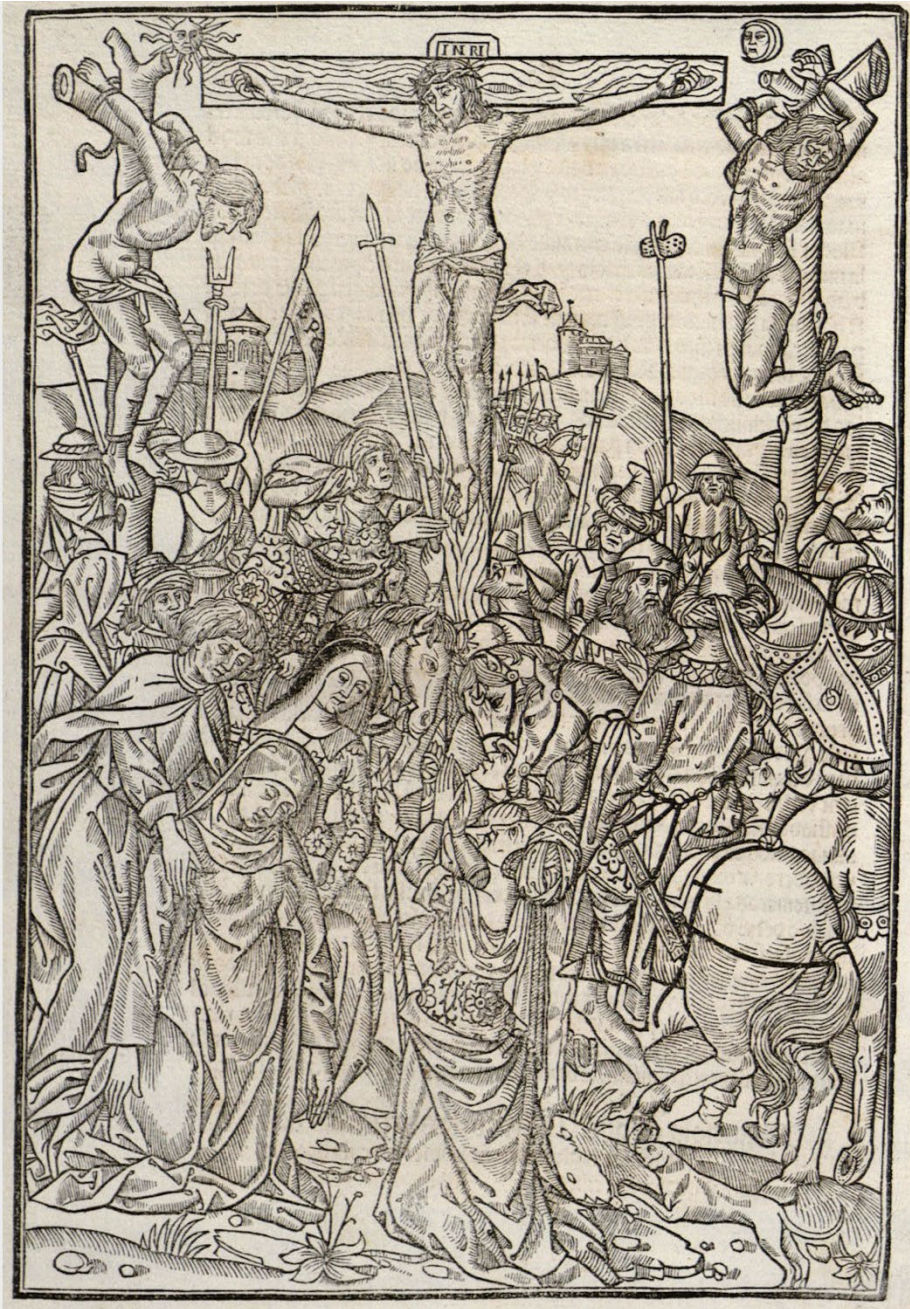
Fig. 7. Jesús crucificado flanqueado por los dos ladrones. Thesoro dela passion , 1496-98: fols. Iv, XCIIIv.