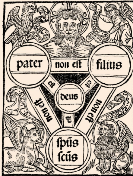
Fig. 3. Escudo de la Santísima Trinidad. Thesoro dela passion ,1494: fol. IV / 1496-98: fol. IVv