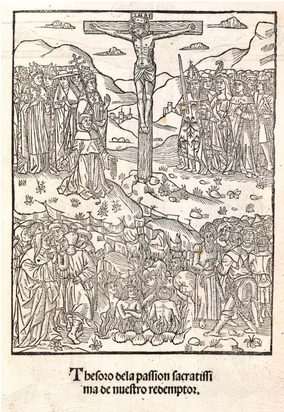
Fig. 1. Cristo en la cruz rodeado por las máximas dignidades eclesiásticas y nobiliarias. Protoportada del Thesoro dela passion , 1494: fol Ir.