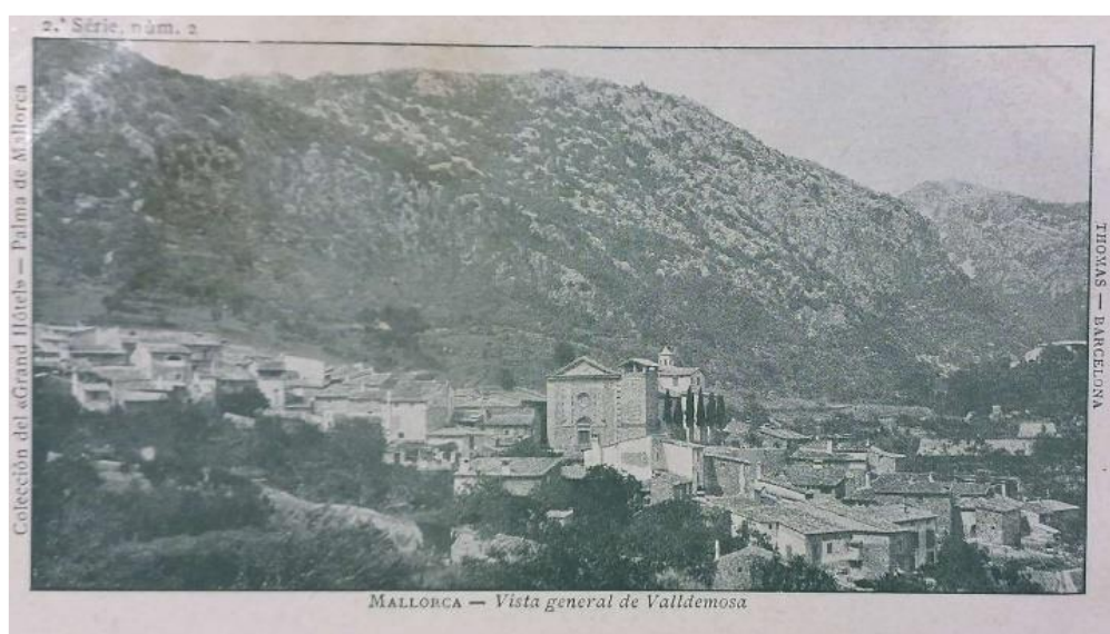
Figura 7: Postal vista del poble de Valldemossa

Mallorca. De manera que, aproximadament l'any 1399, es va decidir convertir l'establiment en un monestir i cedir el palau als monjos. A partir d'aquell moment l'edifici va sofrir diferents transformacions per adaptar-se a les seves noves funcions com la realitzada l'any 1917 quan es va construir un altre monestir. La Cartoixa va deixar de ser un monestir l'any 1835, quan el govern va ordenar la desmoralització de moltes de les possessions de l'església i va ser a partir d'aquell moment que es varen posar a venda les diferents zones de la Cartoixa a particulars.