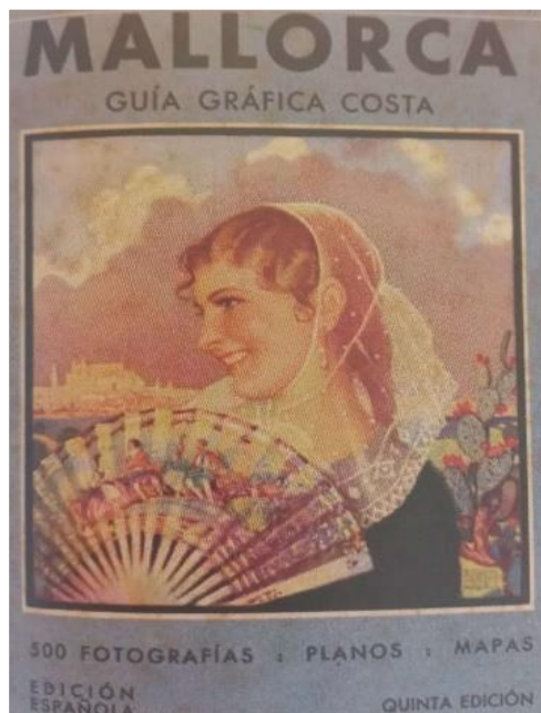
Figura 3: Guía Gráfica Costa 1929 - Josep Costa Ferrer