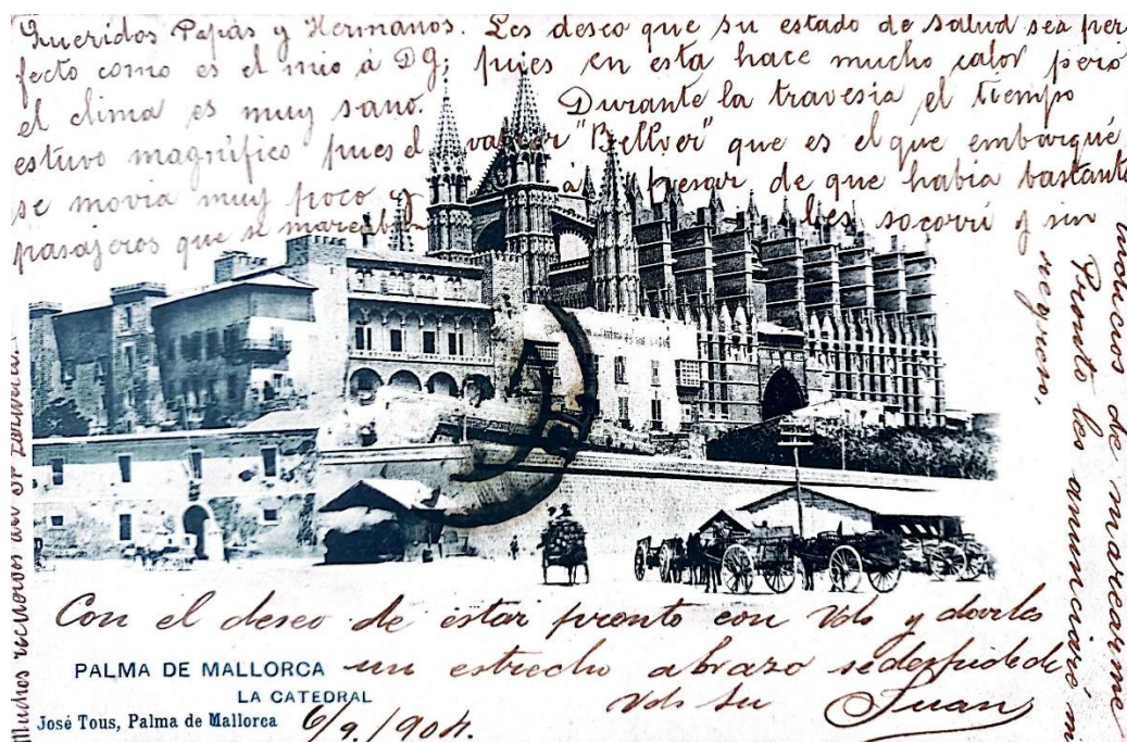
Font: Biblioteca Lluís Alemany