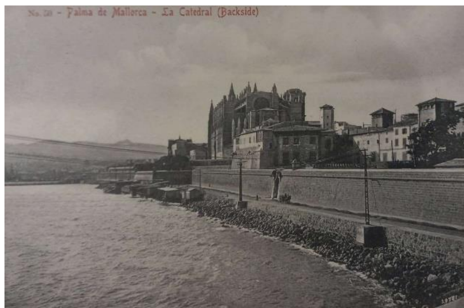
Figura 4: Postal vista panoràmica de la Catedral de Mallorca

Bellver, les cases senyorials, les places i carrers de la ciutat com Plaça Espanya, Plaça Weyer, les Rambles, es Born... també els pobles fora de Palma com Valldemossa, Sóller i Pollença.