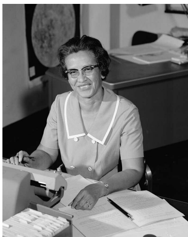
Katherine Coleman Johnson (1966) en su puesto de trabajo de la NASA realizando cálculos simplemente con la ayuda de un lápiz, un papel y una calculadora manual