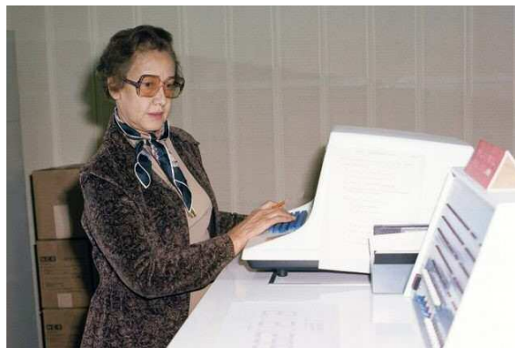
Figura 5. Katherine Johnson en el Centro de Investigación Langley de la NASA en 1980

ticipado de manera activa. El primero de ellos fue calcular la trayectoria del Apolo 11 (1969), el cohete que llevaría al primer hombre a la Luna. Y el segundo fue la misión del Apolo 13 (1970), que tras un inesperado giro de los acontecimientos fue abortada, siendo la ayuda de Katherine fundamental para que la tripulación volviera sana y salva a la Tierra, a través de la implementación de procedimientos y cartas de navegación. Por ello se puede afirmar que Katherine Johnson es toda una heroína.