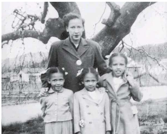
Figura 3. Katherine Johnson y sus hijas