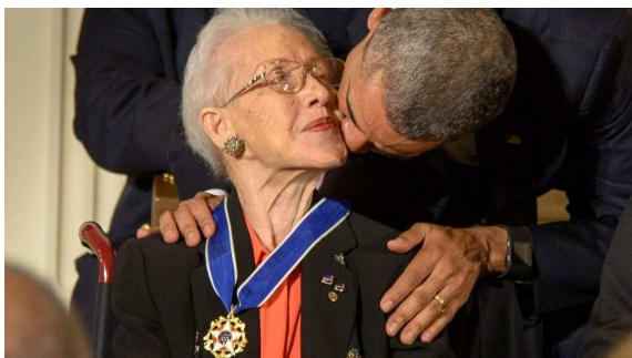
Figura 6. Katherine Johnson recibiendo la Medalla de la Libertad de manos del presidente Barack Obama

En 1999 Katherine fue nombrada como una de las exalumnas más destacadas del lugar donde estudió, la Universidad Estatal de Virginia Occidental, a la cual siempre estará muy agradecida. No será hasta el 16 de noviembre de 2015, cuando fue condecorada con la Medalla Presidencial a la Libertad 5 —siendo hoy en día, la única mujer de la NASA que la ha recibido—, concedida por el entonces presidente de los Estados Unidos, Barack Obama. Este ha sido el premio más importante que ha recibido a lo largo de su carrera.