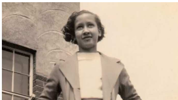
Figura 2. Katherine Johnson adolescente

Debido a las leyes de segregación racial, toda la familia tuvo que mudarse al condado vecino de Kanawha (estado de Virginia Occidental, EE. UU.) para que ella y sus hermanos pudieran continuar con sus estudios en el Instituto Estatal de Virginia Occidental para estudiantes negros. Su precoz talento por las matemáticas se desarrolló hasta tal punto que consiguió graduarse en la enseñanza secundaria de manera prematura, accediendo a la Universidad Estatal de Virginia Occidental 2 a la edad de 15 años. En 1937 Katherine se graduó con una licenciatura summa cum laude , especializada en matemáticas y francés.