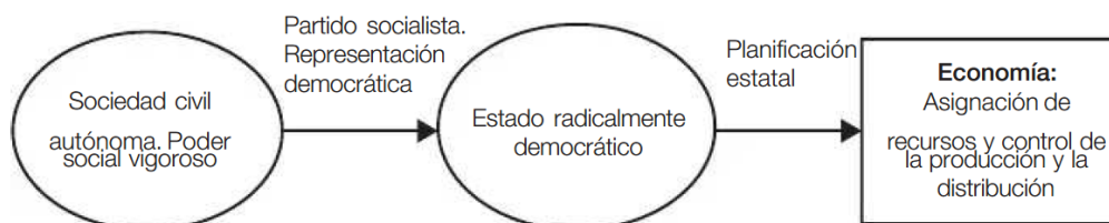
Modelo teórico de socialismo estatista democrático