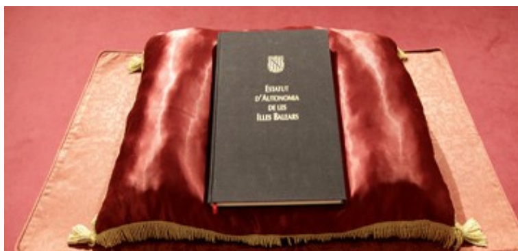
Estatut Autonomia 1983