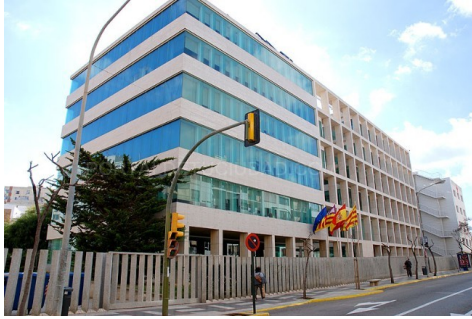
Consell insular d'Eivissa