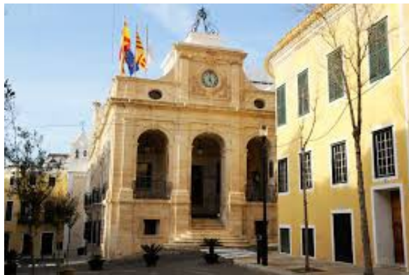
Ajuntament de Maó

Activitat de Recull de Premsa: El curs escolar coincideix també amb el període de sessions d'una de les principals institucions autonòmiques que tenim a les Illes Balears, com és el cas, de el Parlament de les Illes Balears. Per tant, es demanarà als alumnes que llegeixin el diari i que recopilin durant la Unitat Didàctica, notícies relacionades amb l'activitat parlamentària que es dugui a terme en el Parlament de les Illes Balears. Cada alumne haurà de fer aquest petit recull de premsa. A més, en aquest recull de premsa també es poden posar notícies relacionades amb els Consells Insulars ( si n'apareixen) i igualment es poden posar notícies del municipi de l'alumne. Sols serà un petit dossier. Aquest recull de premsa es pot fer tant a través de diari digitals com de diaris editats en paper. Per facilitar la recerca dels alumnes s'acceptaran els principals diaris que es publiquen a les Illes Balears com són el Diario de Mallorca, Ultima Hora, Diari de Balears i l'Ara Balears. S'exigirà als alumnes que de cada notícia que posin al dossier, la llegeixin i a més en facin un petit resum. És una activitat adreçada per practicar la competència del tractament de la informació principalment. A més, també es practica la competència digital ja que es poden cercar notícies a través de la xarxa d'Internet. L'activitat del recull