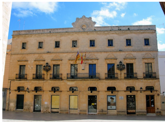
Consell insular de Menorca