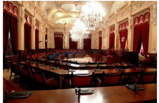
Parlament de les Illes Balears