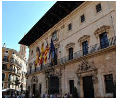
Ajuntament de Palma