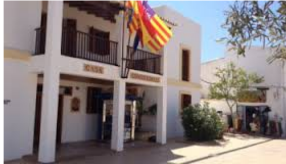
Consell insular de Formentera