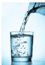
Imatge d'un líquid