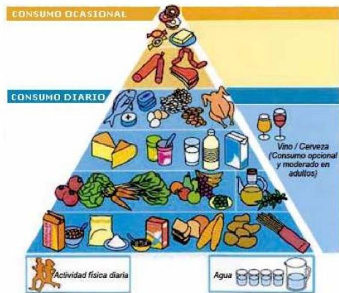
Figura 1. Pirámide de Alimentación Saludable (SENC 2004).

Integra los alimentos propios de la dieta española característicos de una dieta mediterránea. El cumplimiento de esta pirámide, en la que no falta la recomendación de mantener una actividad física diaria, e incluso refleja el consumo responsable y opcional de bebidas fermentadas de baja graduación como uno de los hábitos más arraigados en nuestra cultura gastronómica, podría suponer una herramienta adecuada para el mantenimiento de la salud y la prevención de la enfermedad.