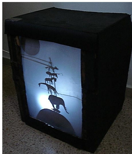
Imatge 6. Teatre utilitzat per explicar "De què fa gust la Lluna?". Elaboració pròpia.