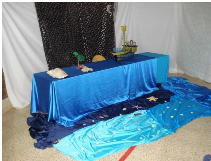
Imatge 2. Recursos complementaris utilitzats per explicar "El pirata de les estrelles". Elaboració pròpia.

Per últim, es va fer sonar una música, fluijeta, de fons, amb sons de la mar que embolcallava tot l'espai preparat per al conte. Aquesta música, a vegades tapava la veu del narrador, per tant, quan s'utilitzi aquest recurs s'ha d'anar en compte. Ara bé, amb tot, es creà un clima màgic que afavorí enormement l'atenció dels infants.