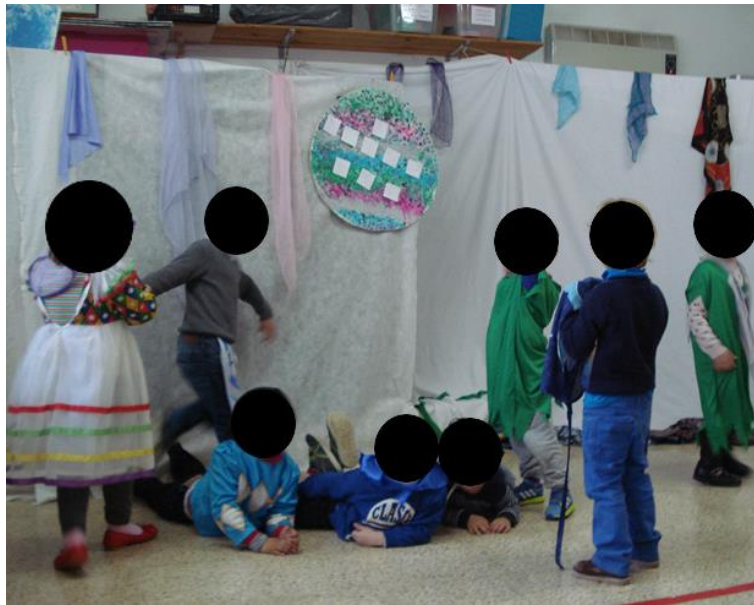
Imatge 7. Infants de quatre anys realitzant l'activitat "Dramatització d'un conte inventat". Elaboració pròpia.

En aquesta transcripció de l'obra representada pels infants, no s'han inclòs acotacions perquè els infants s'expressen cada vegada d'una manera diferent, tal i com senten en aquell moment. Per tant, no té sentit intentar planificar els moviments i accions dels menuts. També es precis comentar que és el mestre qui desenvolupà el paper del narrador. Per això, hi hagué moments en què la dramatització s'assemblava més a un conte motor que a un teatre.