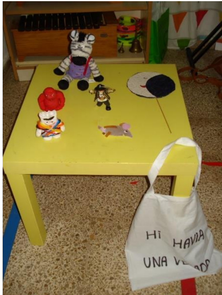
Imatge 10. Recursos complementaris utilitzats per a l'activitat "Amanida de contes". Elaboració pròpia.