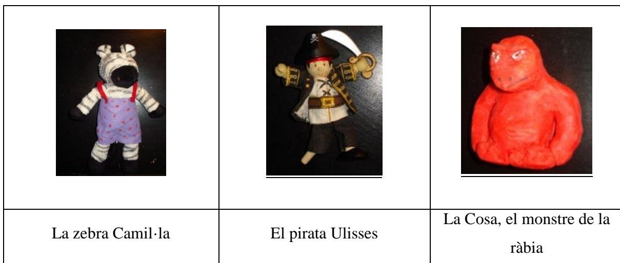
Imatge 8. Personatges que surten a l'activitat "Amanida de contes". Elaboració pròpia.