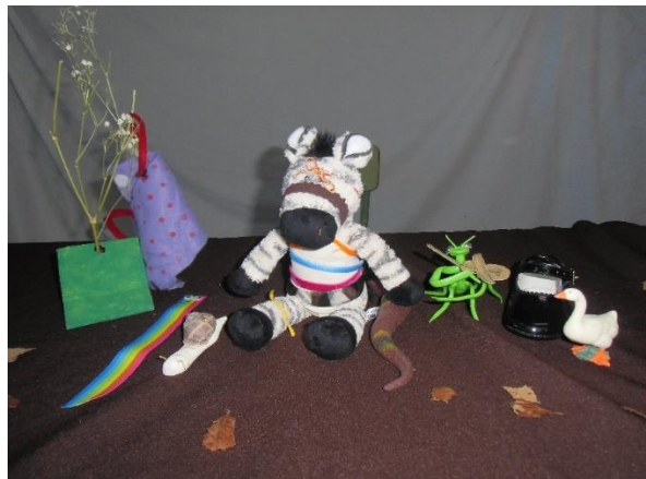
Imatge 4. Titelles utilitzats per explicar "La zebra Camil-la". Elaboració pròpia.