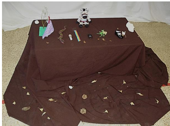
Imatge 3. Recursos complementaris utilitzats per a la narració de "La zebra Camil-la". Elaboració pròpia.

Per altra banda, com es pot observar a la imatge quatre, tots els personatges foren titelles de joguina, excepte l'arc de Sant Martí que fou simbolitzat amb un tros de tela de colors i el caragol que fou confeccionat a partir de fang blanc i una closca de caragol de veritat.