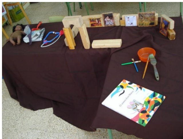
Imatge 1. Recursos complementaris utilitzats per a la narració del conte "El somni d'en Mateu". Elaboració pròpia.

Per explicar aquest conte a l'aula de quatre anys, es van preparar alguns elements visuals que ajudessin a marcar les diferents escenes de l'obra. Així, en una cantonada de la taula es van representar les golfes on vivia en Mateu. Aquestes varen ser confeccionades a partir de diaris vells, una granera i una pala i una pepa (descrita al text). Al mig, es va representar el museu que anava a visitar el Museu. Aquest es va construir amb peces de fusta, del racó de construccions de l'aula. A més, s'hi van col·locar quadres en petit format per tal que es veiés que era un Museu. Ara bé, els quadres que s'escolliren no són els que surten a la història. Al respecte, cal esmentar que si s'hagués utilitzat els quadres que surten al conte els infants, com és normal, no s'haguessin estranyat quan la narradora explicava que en Mateu va veure, per exemple, el quadre del Rey Ratolí V. Per últim, es representà les escenes finals en què el Mateu es fa pintor i, per això, es col·locà un ribell amb uns quants pinzells de l'aula. El protagonista, el Ratolí Mateu, fou realitzat amb feltre. Per tant, el protagonista era un titella de tres dimensions que es manejava amb la mà.