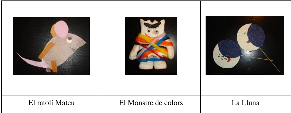
Imatge 9. Personatges de l'activitat "Amanida de contes". Elaboració pròpia.