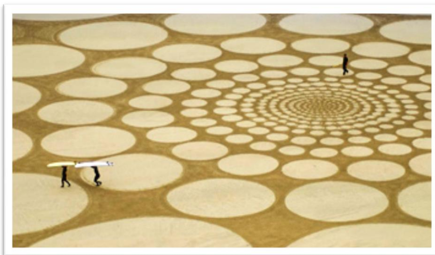
A partir de l'obra Surfers in Circles de Jim Denevan realitzada a Tunitas Creek Beach, Califòrnia, USA, l'any 2006 18