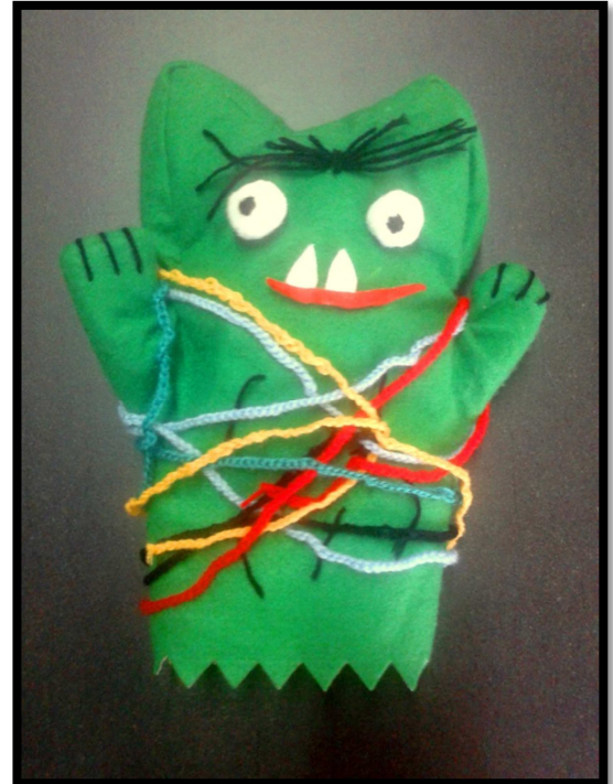
Monstre de colors finalitzat