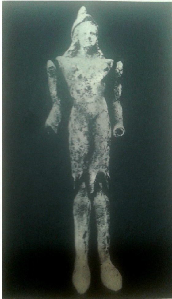
Fig. 2. Titella articulat grec, és de terracota, és prototip trobat a Catalunya a Empúries. Població grega. Titella articulat (1200-146 aC.). Actualment es conserva en el museu del Louvre.