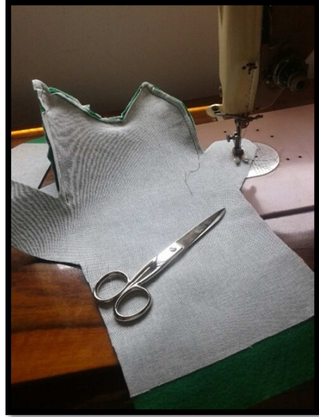
Pas del patró a la tela i cosir-lo