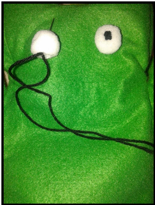
Confecció i cosida dels ulls