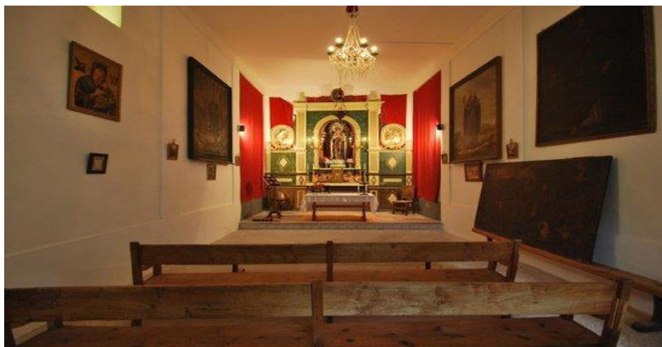
Imatge 8. Capella de can Beneït.

Binibona, el nucli fundacional va sorgir a l'entorn de les cases de Son Catxo, actualment conegudes com Can Beneït. A finals del segle XVI hi havia un total de set cases. Un segle més tard se'n documenten deu i a finals del XIX una trentena. A principis del segle XX el nucli estava conformat per unes 27 cases i comptà amb batle pedani, capellà i escola pública d'infants, inaugurada al 1919.