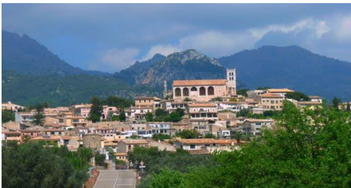
Imatge 3 Selva

Selva és un municipi del vessant de migjorn de la serra de Tramuntana i de la comarca del Raiguer. Té una superfície de 47,48 km 2 i compta amb 3.900 habitants (dades de 2016). A més de la vila, té els nuclis de Biniamar, Binibona, Caimari i Moscarí. La vila de Selva ocupa els terrenys de l'antiga alqueria islàmica de Xilvar, i es divideix en tres nuclis o barris històrics: al centre, el puig de Sant Llorenç –o directament, es Puig-, al nord-est Camarata, i Valella al sud-oest.