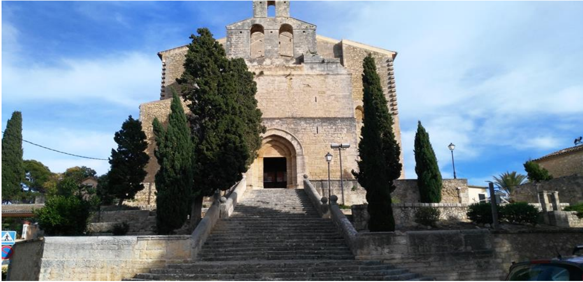
Imatge 4. Església de Selva.