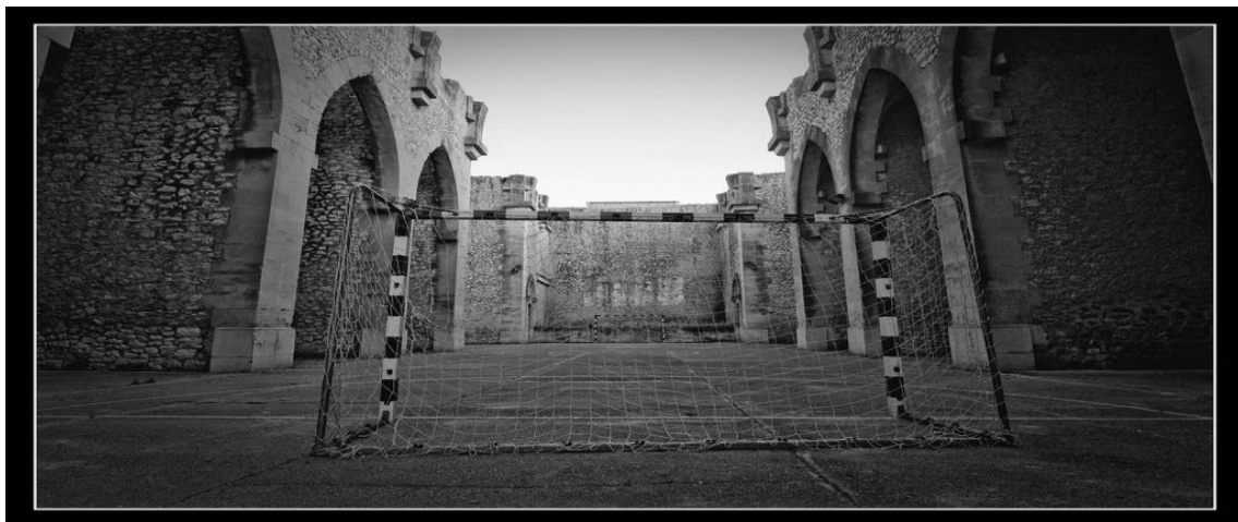
Imatge 7. Catedral de Biniamar