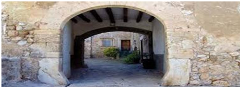
Imatge 5. Cases de son Albertí

A Caimari hi ha dos elements arquitectònics destacables: L'església Vella, que com indicia el seu nom, és l'antic temple de Caimari. Substituí l'oratori privat de Son Albertí, i el seu origen prové de l'acord de 1731 de construir un oratori públic per al llogaret. Les obres començaren l'any 1746 i s'acabaren el 1757 31 . Amb l'augment demogràfic de principis de segle XIX, l'edifici s'amplià entre els anys 1845-47, però seguia sent insuficient i el 1890 s'abandonà, quan fou consagrada l'Església Nova. Actualment es dedica a sala d'actes i de reunions.