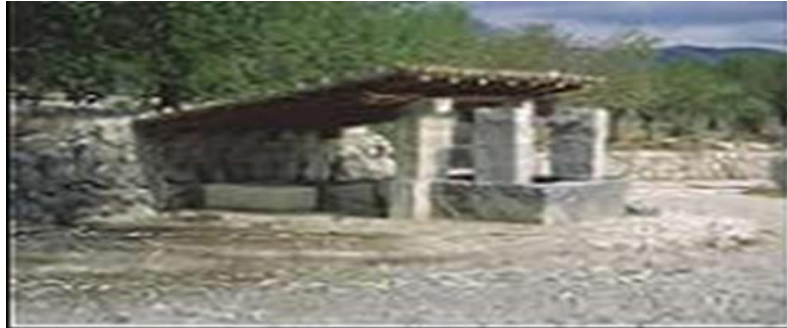
Imatge 6. Pou de Son Ferrer

I el pou de Son Ferrer o de ses Casetes, localitzat al camí del mateix nom, (el primer camí a l'esquerra sortint de Moscarí cap a Campanet). Està paredat en sec, té planta rectangular i arriba als 8'2 m de profunditat. Exteriorment presenta un coll fet de blocs de pedra viva, en una de les quals podem llegir la data de 1806. 33