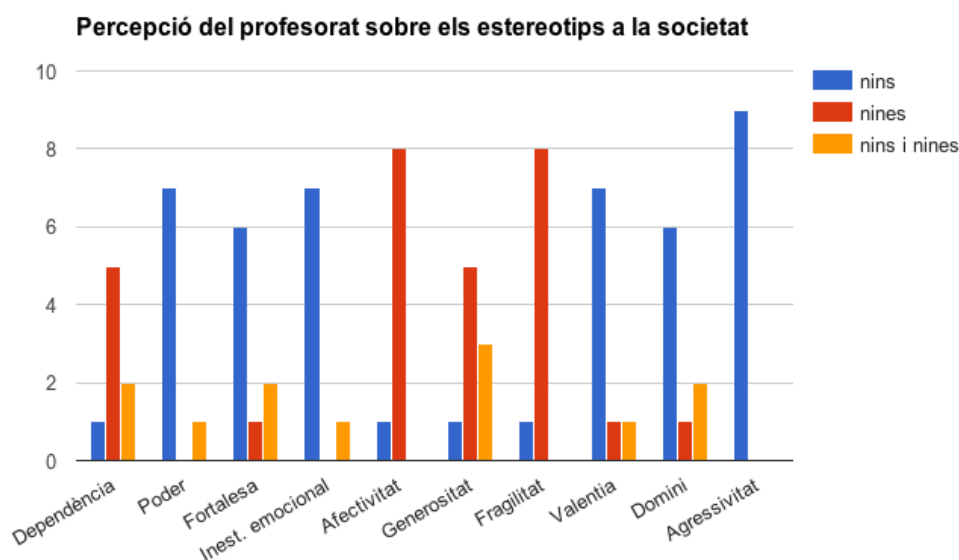
Gràfic 2: Percepció del professorat vers els estereotips a la societat.