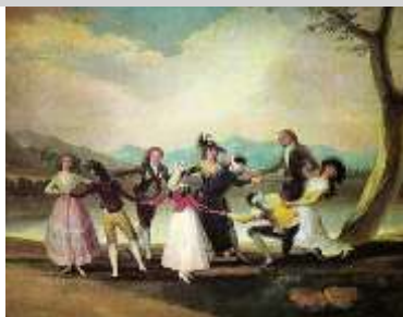
20 Imatge 1:“La gallina ciega”

Temporalització: 45 – 50 minuts, dues sessions a la setmana.