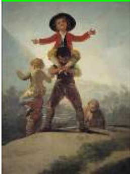
21 Imatge 2: “Las gigantillas”

Temporalització: 45 – 50 minuts, dues sessions a la setmana.