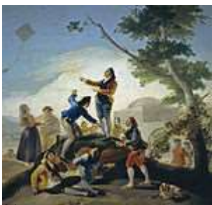
24 Imatge 5: “La cometa”

Temporalització: 45 – 50 minuts dues sessions a la setmana.